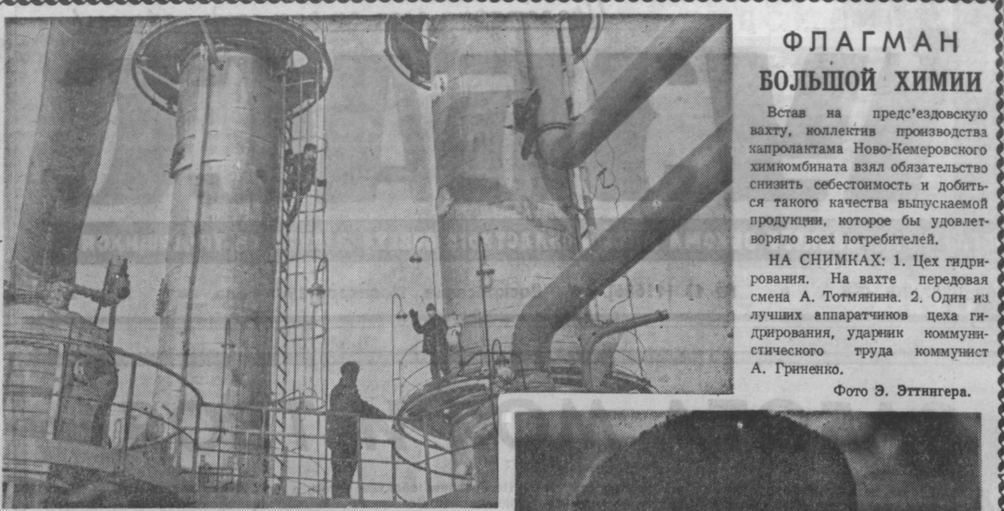
ФЛАГМАН БОЛЬШОЙ ХИМИИ

Встав на предсезонную вахту, коллектив производственного подразделения Ново-Кемеровского химкомбината взял обязательство снизить себестоимость и добиться такого качества выпускаемой продукции, которое бы удовлетворяло всех потребителей.