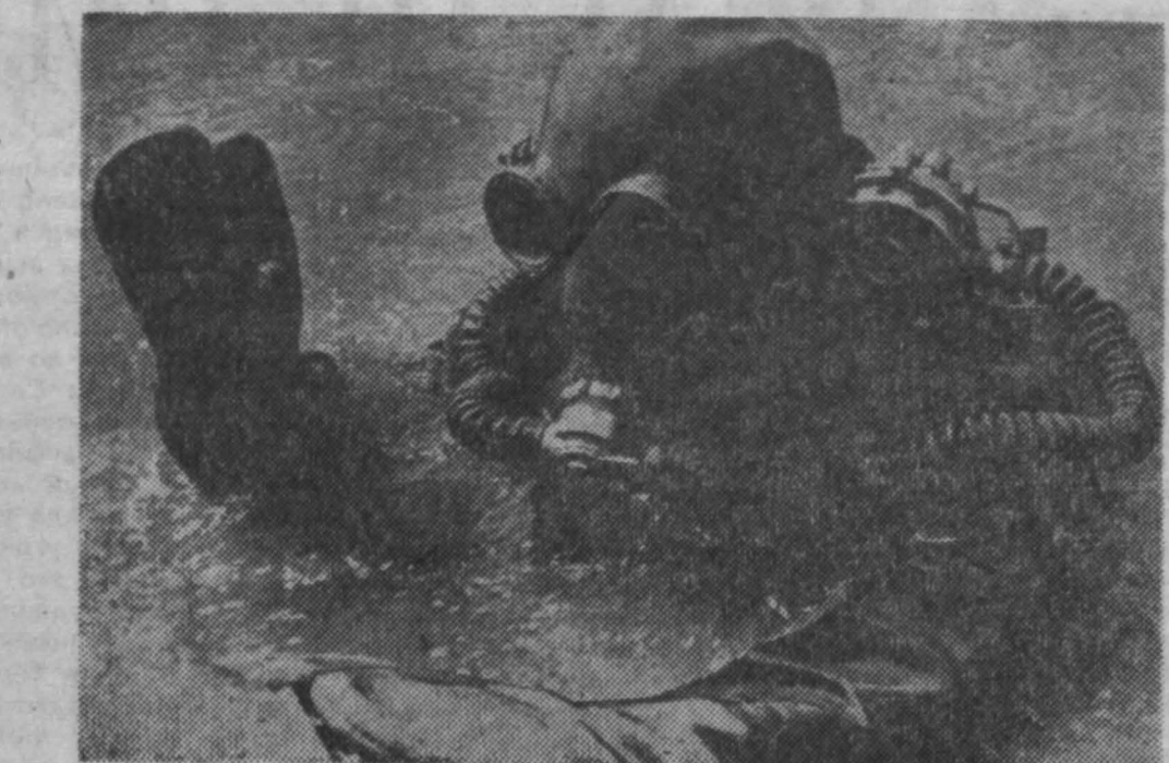
На снимках Мчатся спасательные лодки по сигналу учебной тревоги.