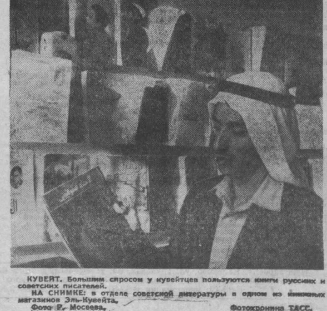
КУБЕРТ. Большие спросы у кубейтцев пользуются книги русских и советских писателей. НА СНИМКЕ: в отделе советской литературы в одном из книжных магазинов Эль-Кувейта.

Наряду с Кубой в Венгрии социалистического лагеря. На днях делегация Братской Чехословакии, гостившая на острове Свободы, подписала с кубинскими транспортными организациями договор о морском сообщении между двумя странами.