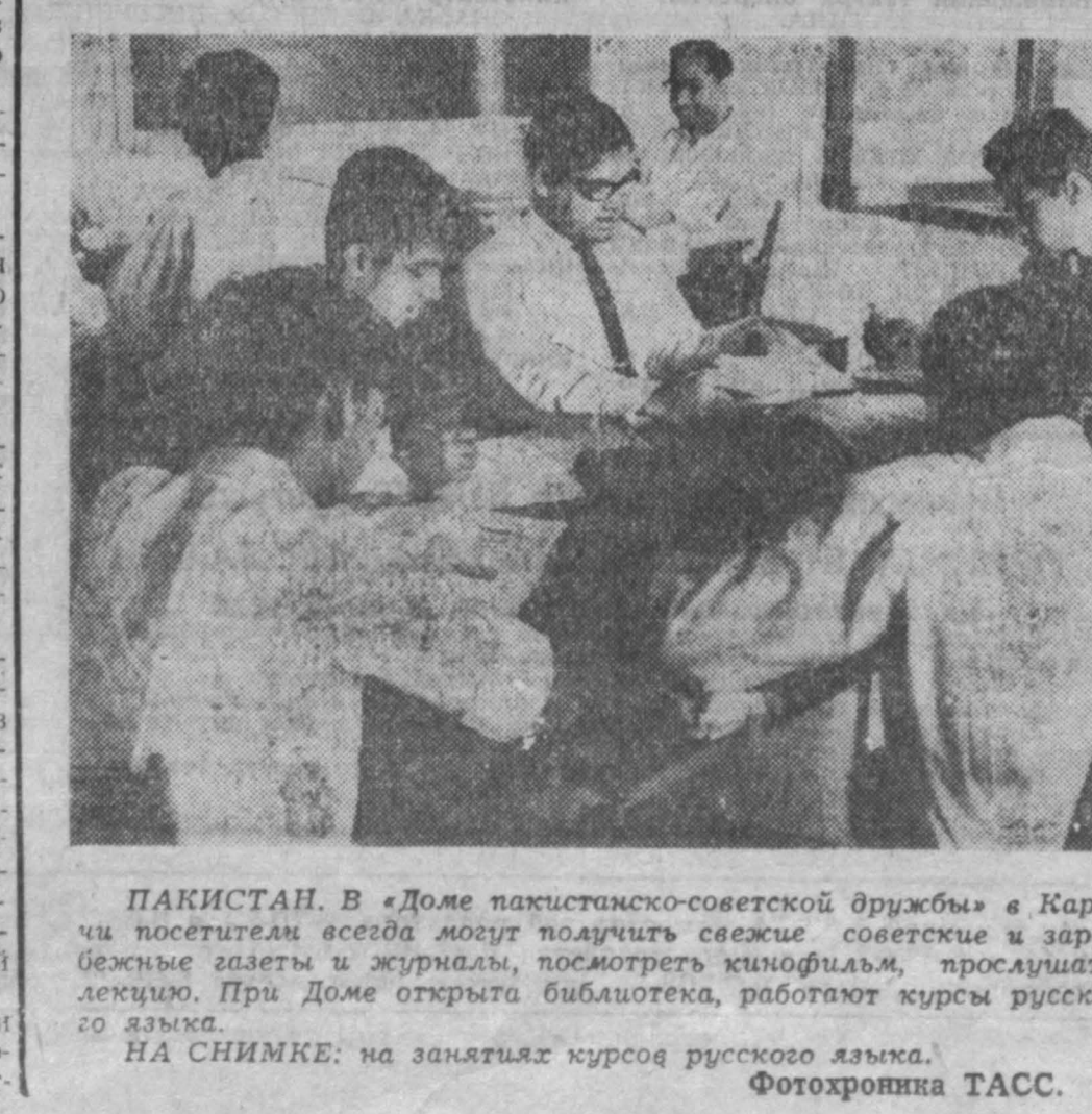
ПАКИСТАН. В «Доме пакистанско-советской дружбы» в Карачи посетители всегда могут получить свежие советские и зарубежные газеты и журналы, посмотреть кинофильмы, прослушать лекцию. При Доме открыта библиотека, работают курсы русского языка. НА СНИМКЕ: на занятиях курсов русского языка.

ЗОЛОТЫЕ ЗАПАСЫ ФРАНЦИИ ПАРИЖ, 18 мая. (ТАСС). Государственные запасы золота и обратной валюты Франции в 1965 году возросли на 1 млрд. 750 млн. франков и составляют в настоящее время 26 млрд. 737 млн. франков, говорится в докладе директора французского банка президенту де Голлю.