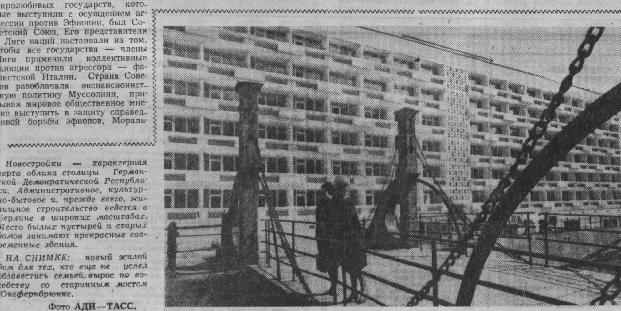
На снимке: новый жилой дом для тех, кто еще не успел обзавестись семьей, вырос по соседству со старинным мостом Юнгфербрюкке.

На Яве сегодня началось извержение еще одного вулкана — Мерани, расположенного в 29-километрах от Семаранга.