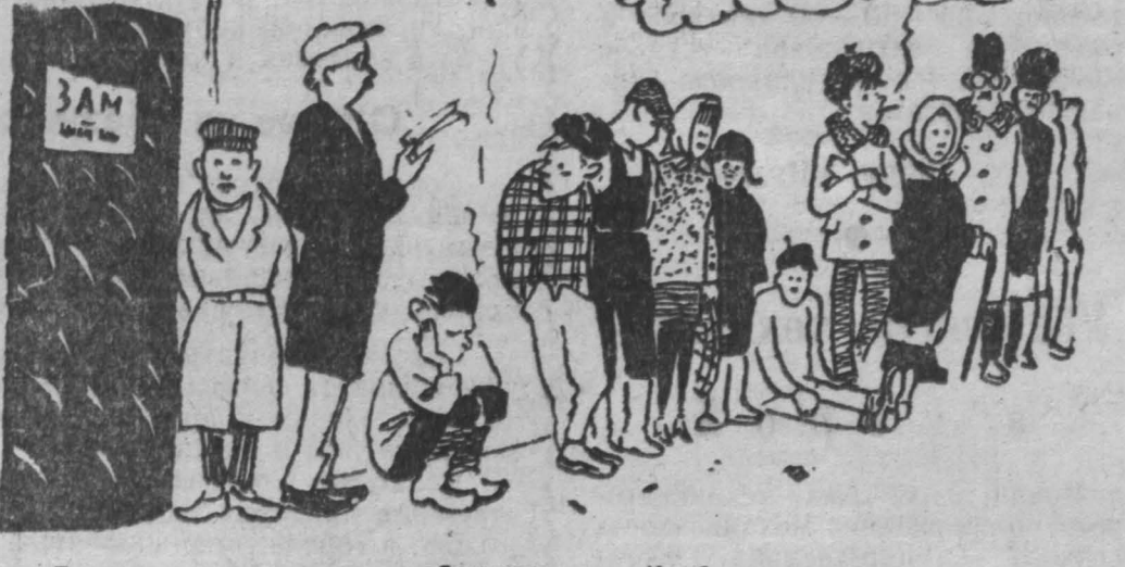
Такую картину можно наблюдать на «Кузбассэлектромоторе», когда ведет прием зам. директора.