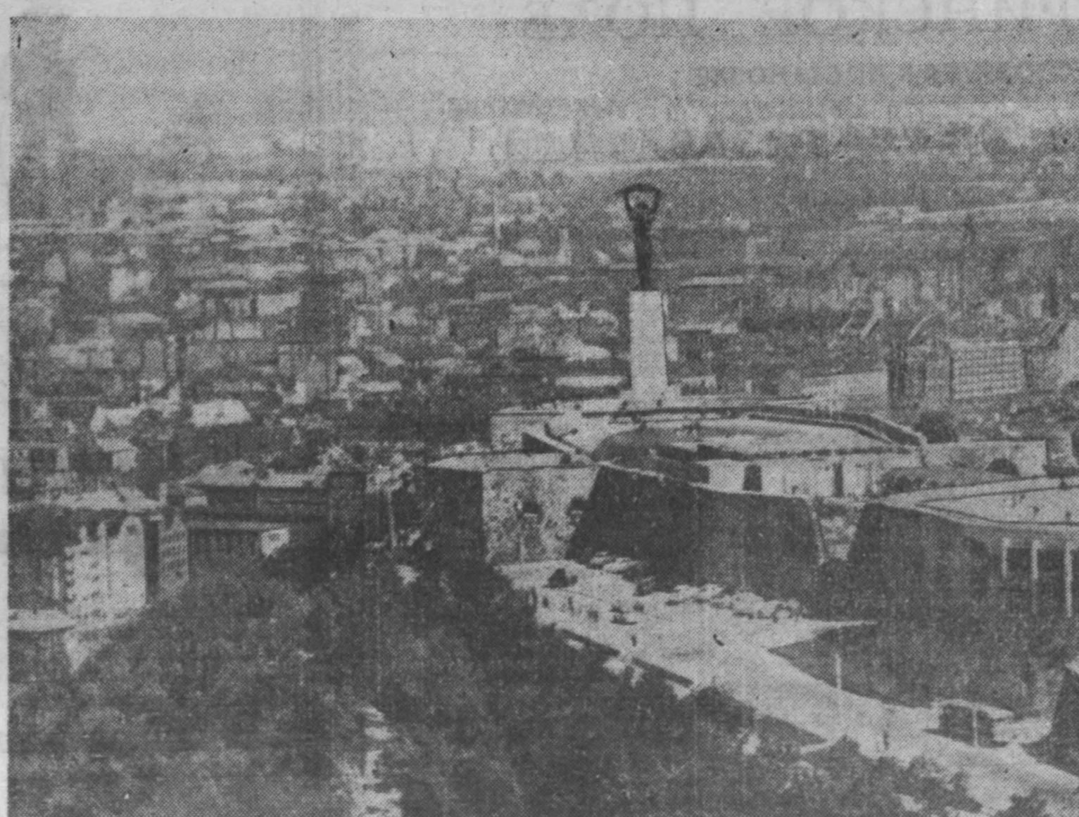
Будапешт — столица народной Венгрии. В центре снимка — монумент Свободы на горе Геллерт.

По этим вопросам пленум одобрил две резолюции.