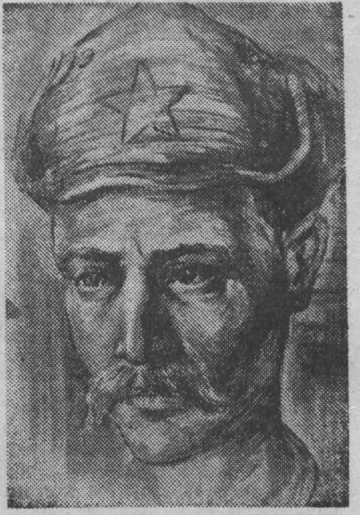
«Артиллерийского офицера три раза приговаривали к повешению за побег, и три раза он бежал из лагеря».