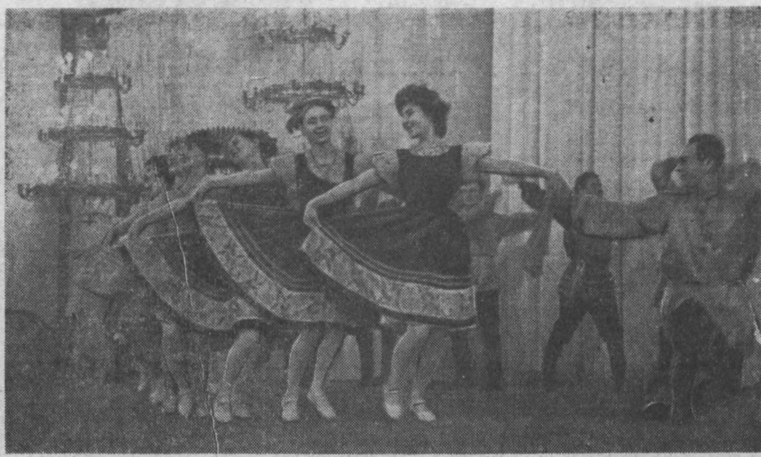
В Москве проходят заключительные концерты Всероссийского смотра сельской художественной самодеятельности. НА СНИМКЕ: В Колонном зале Дома союзов выступает танцевальный коллектив Ленинск-Кузнецкого племхоза Кемеровской области.

Дело будет слушаться в нарсуде Центрального района г. Кемерово.