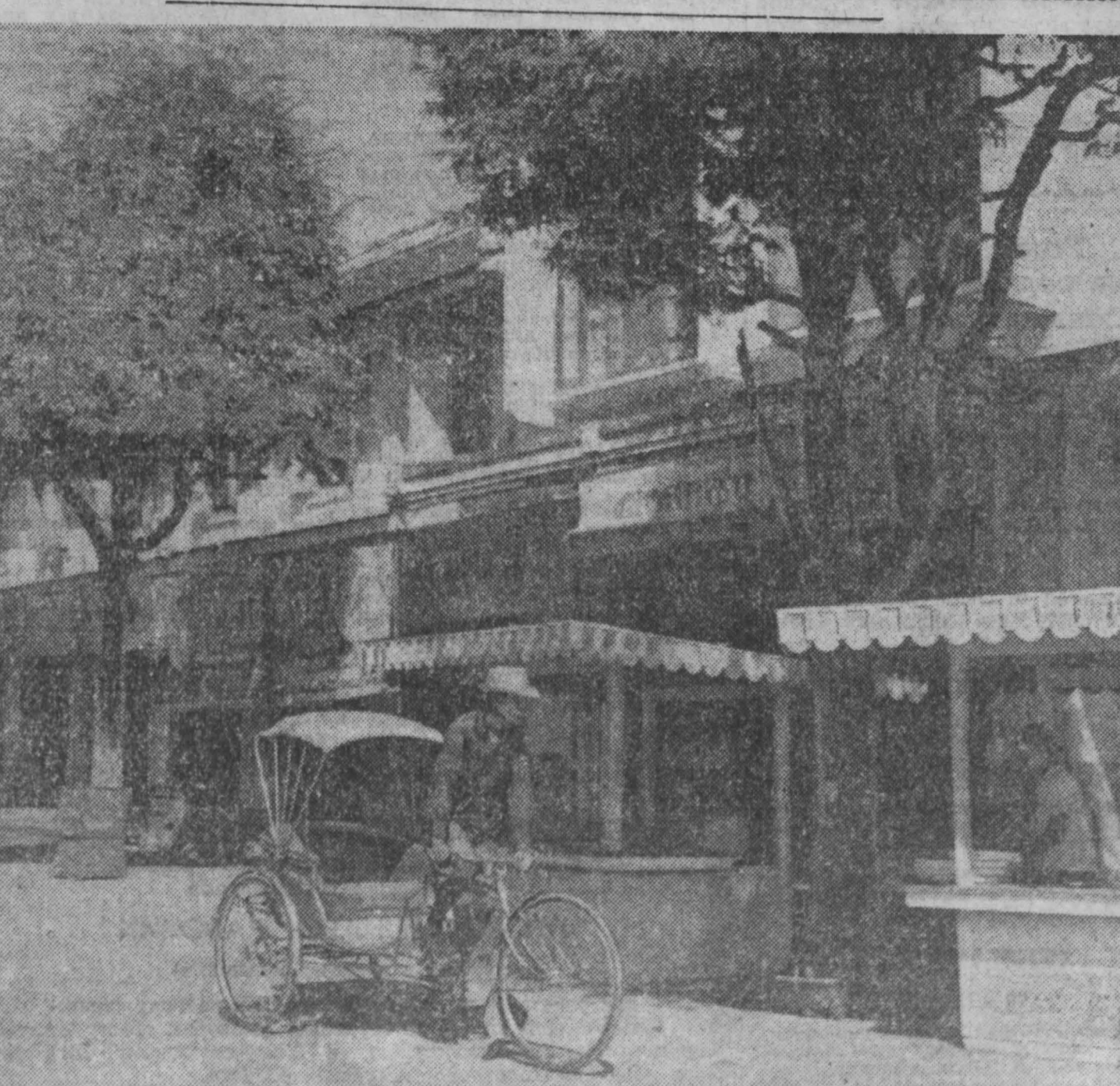
ТАИЛАНД. Велорикша — обычный вид транспорта наряду с автобусами на улицах Бангкока и других городов. НА СНИМКЕ: велорикша в Бангкоке.

«КУЗБАСС», 3-я стр., 9 января 1965 года.