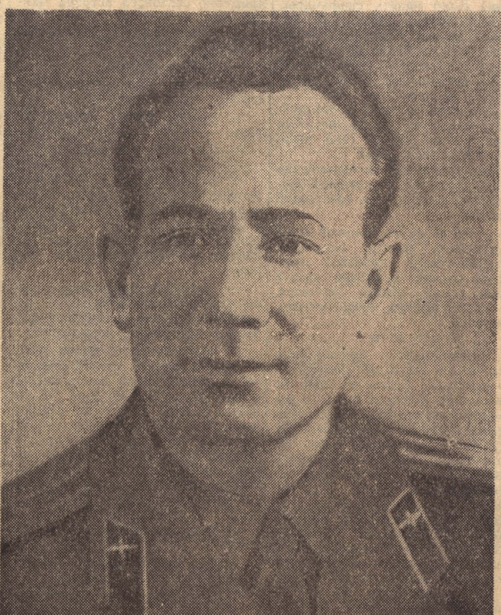
Алексей Архипович ЛЕОНОВ (Принято по фототелеграфу)