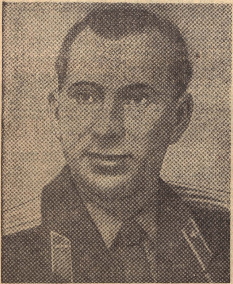
Павел Иванович БЕЛЯЕВ