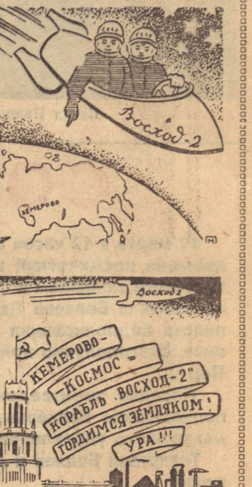
Рис. М. Панькова.