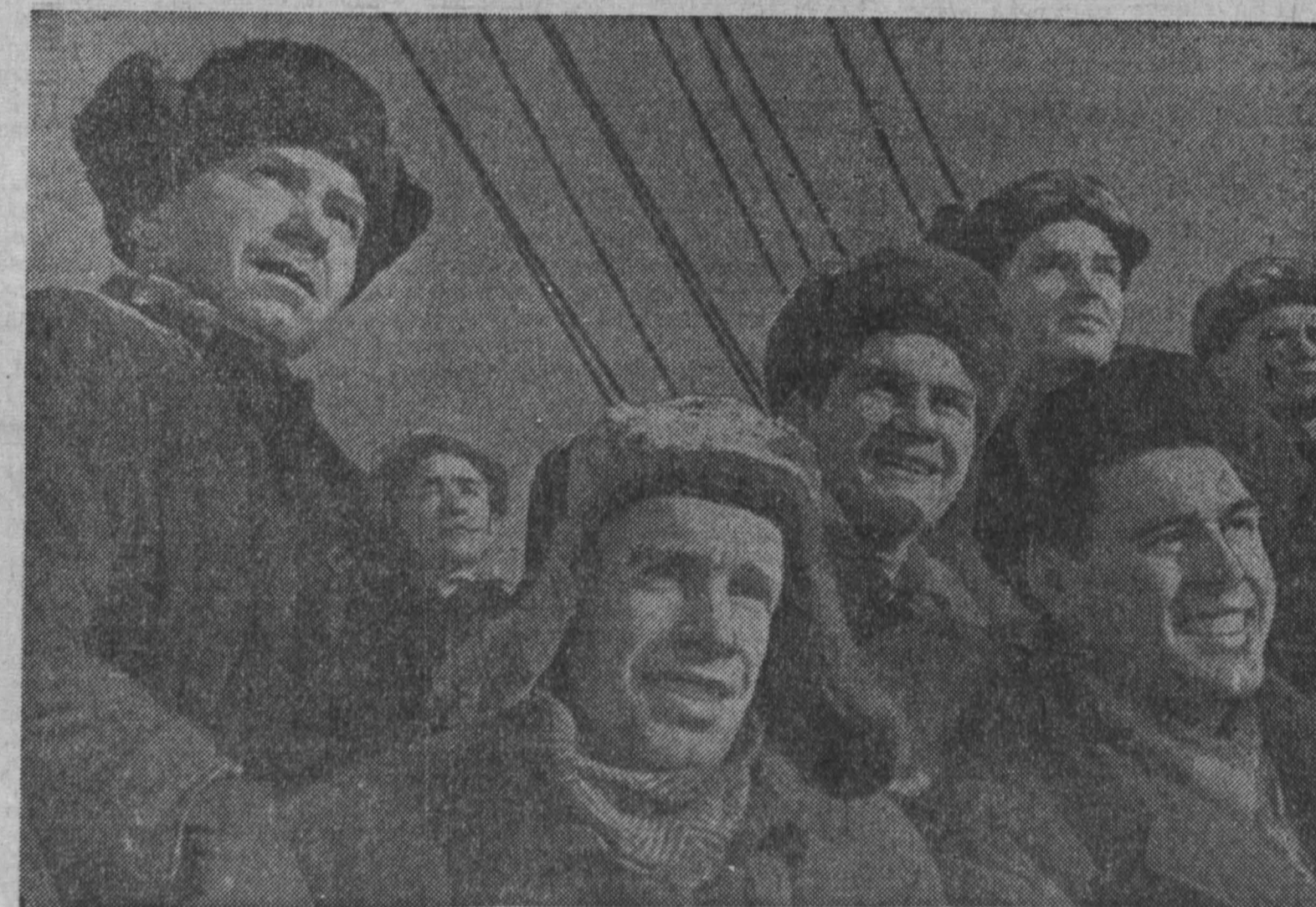
На фотоконкурс «КУЗБАСС СЕГОДНЯ»

Подсчеты показывают, что область в целом имеет все возможности уже в первой декаде марта выполнить квартальный план заготовок молока, яиц и мяса, создать предпосылки для успешного выполнения полугодового плана.