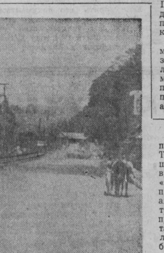
КОСТА-РИКА. Главная улица порта Гольфия на побережье Тихого океана. Залатанные крыши деревянных домиков, где живут «бананерос» — рабочие «Юнайтед Фрут компани». Суда, принадлежащие этому североамериканскому спуту, увозят в трюмах сладкие бананы — 30 процентов национального экспорта страны. Тысячи рабочих и земледельцев Коста-Рики живут в беспорядочной трущобе.

лись такие важные международные проблемы, как борьба за мир во всем мире, за прекращение ядерных испытаний и разоружение народов колониальных и зависимых стран за национальное освобождение и так далее, имеющие взаимный интерес для обеих стран. В результате переговоров были подписаны важные соглашения об экономическом, техническом, научном и культурном сотрудничестве между двумя странами. Германская Демократическая Республика окажет помощь ОАР в осуществлении пятилетнего плана развития экономики страны. Президент Насер, заявив далее, что ГДР и во время его визита будут продолжены переговоры по политическим, экономическим и культурным вопросам. Говоря об аресте конголезских властями корреспондента газеты «Известия» Николая Хохлова, Л. Болль заявил, что Германская Демократическая Республика решительно осуждает политику Чомбе и незаконный арест советского журналиста.