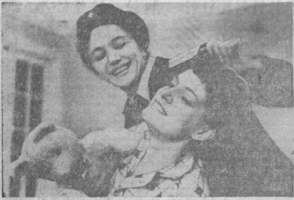
Новокузнецкий городской драматический театр поставил к школьным каникулам пьесу Цезаря Солодаря «Правда о старом кинжале».