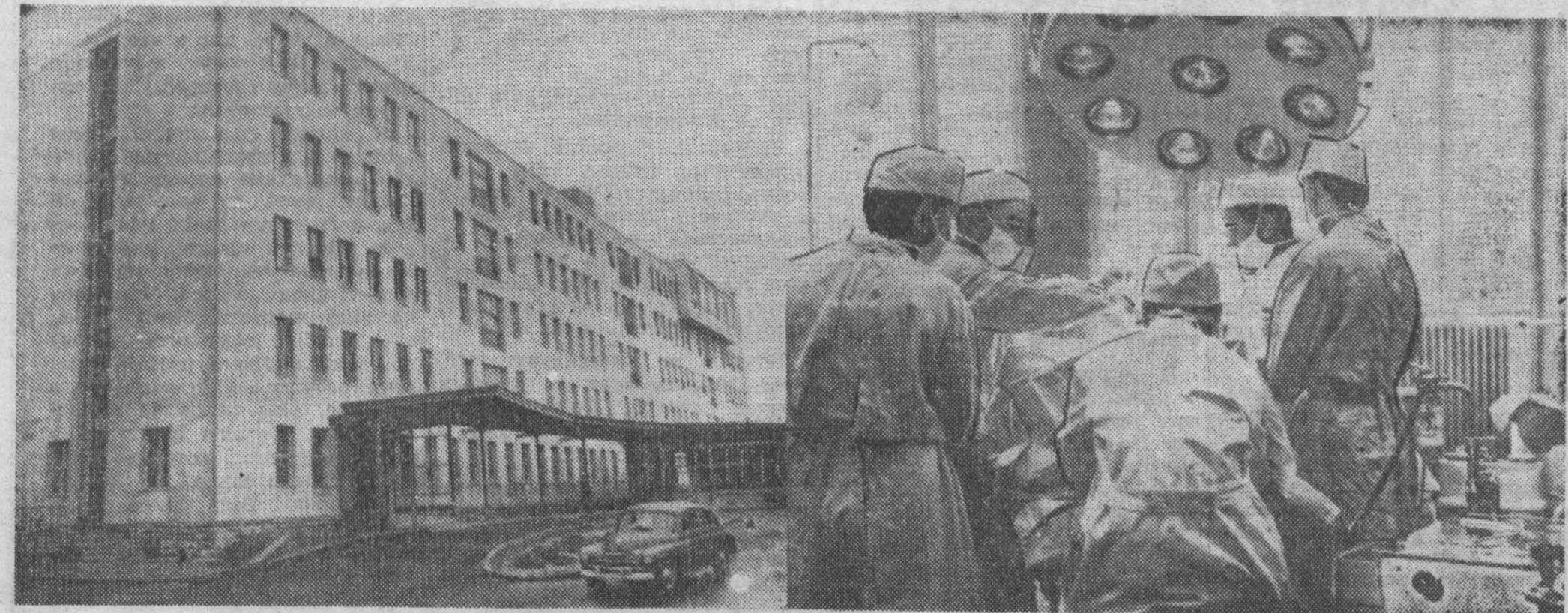
Из года в год увеличивается в мировой Венгрии ассимиляция на строительство лечебных учреждений. Сооружение прекрасных оборудованных больниц и поликлиник за счет государства — один из источников повышения реальных доходов трудящихся. НА СНИМКАХ: слева — новый корпус больницы в области Веспрем; справа — в одной из его операционных.