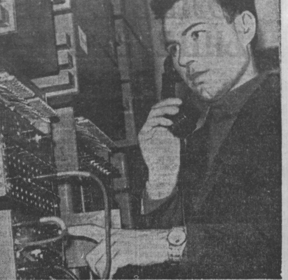
В Ленинске-Кузнецком установлена аппаратура полуматематической междугородной связи. Теперь, приняв заказ, телефонистка Ленинска-Кузнецкого сама набирает номер кемеровского абонента.

Строгое регулирование охоты, полный запрет ее на некоторые виды, сказали свое слово. В 50-х годах наша тайга была намного богаче, чем в советское время. Резко увеличился поголовье соболя, лоса, косули, марала. Прижились ног седы — ондатра, норка, бобр. На орошем уровне стояло количество