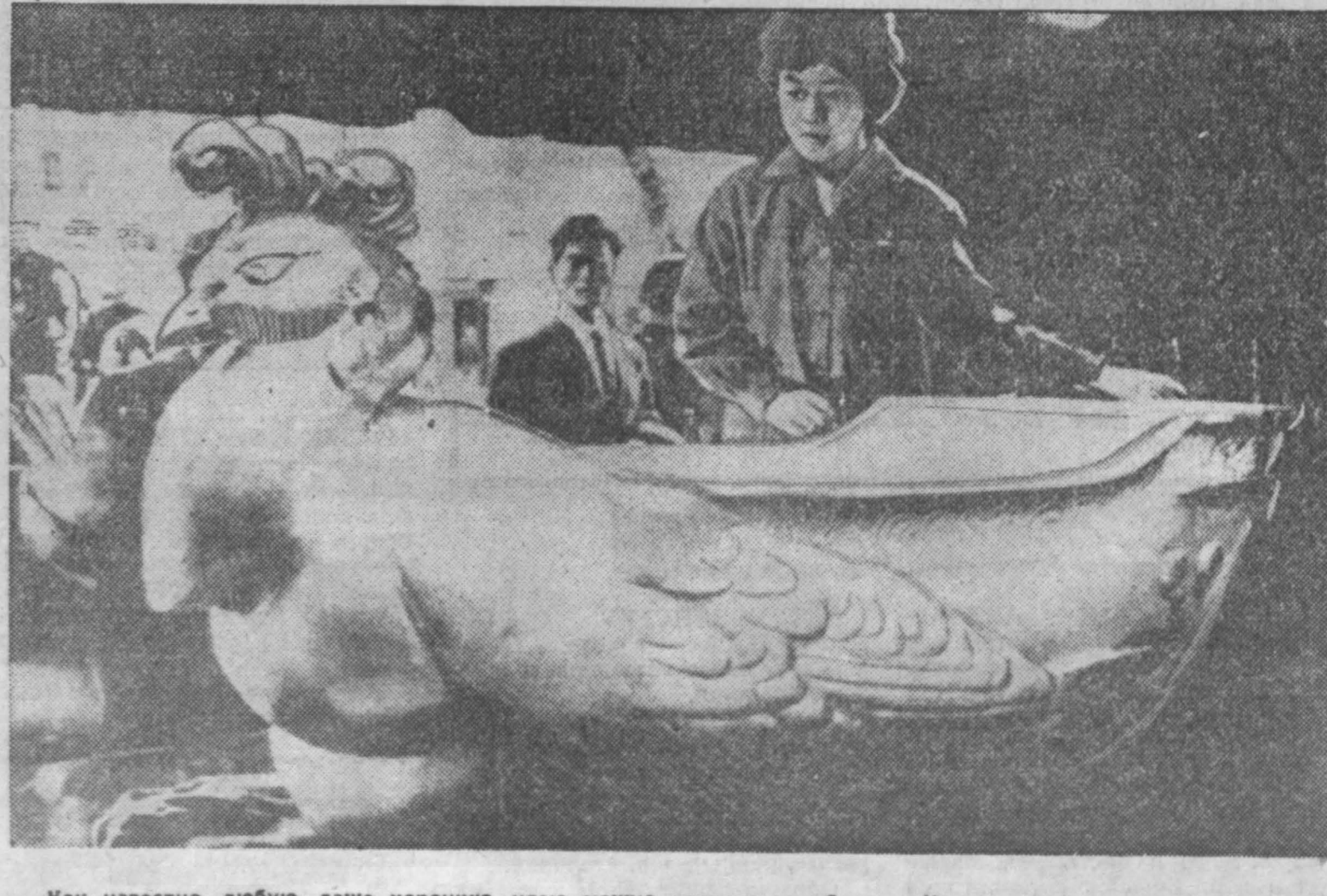
Как известно, любовь, даже хорошую, идею можно довести до абсурда. Именно так и получилось в одной из гостиниц в районе Тонно. Здесь была установлена ванна, отлитая из чистого золота. Эта затея, предпринятая якобы с целью гигиены (золото обладает бактерицидными свойствами), стоила не много, но зато 360 тысяч долларов. Тем не менее владельцы гостиницы, для которых ванна служит рекламой, надеются быстро возместить расходы. Минута купания в гигиенической ванне будет стоить посетителям доллар. ИА СНИМКИ: золотая ванна в тонкиской гостинице.