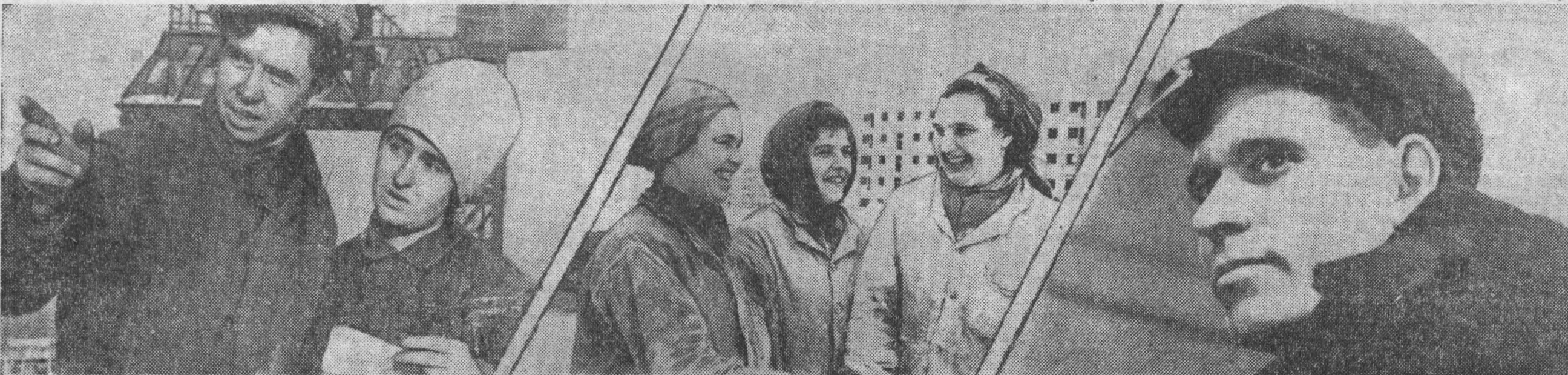
ПРОЛЕТАРИИ ВСЕХ СТРАН, СОЕДИНЯЙТЕСЬ!