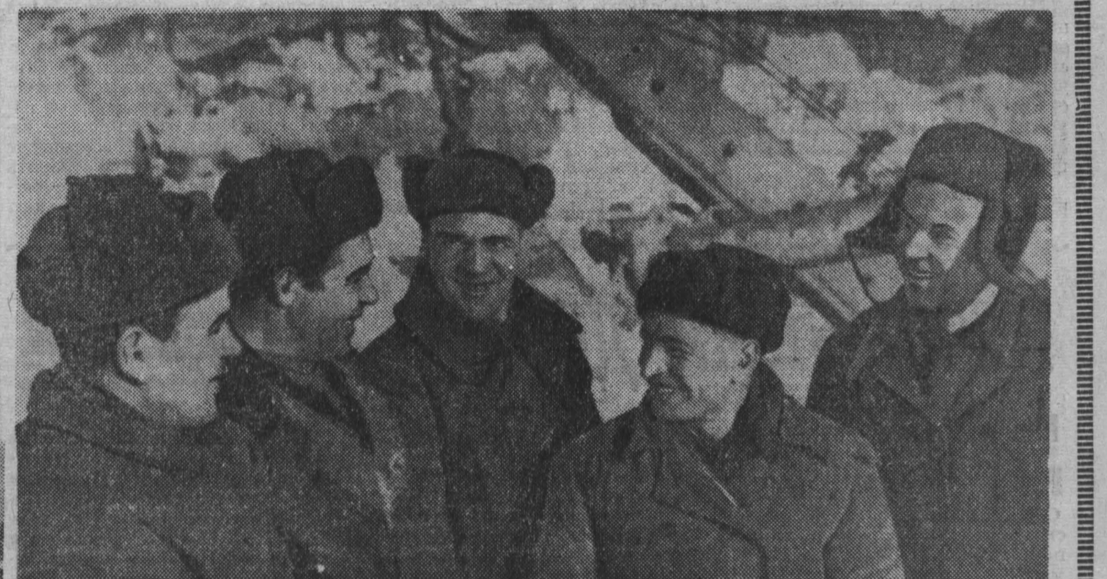
НА СНИМКАХ: панорама Ново-Колбинского участка Черниговского разреза.