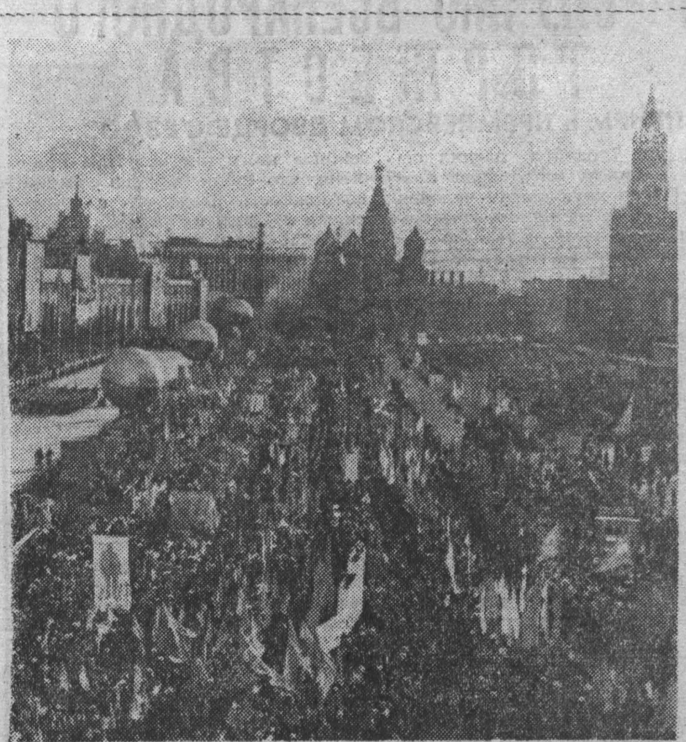
Демонстрация представителей трудящихся на Красной площади.