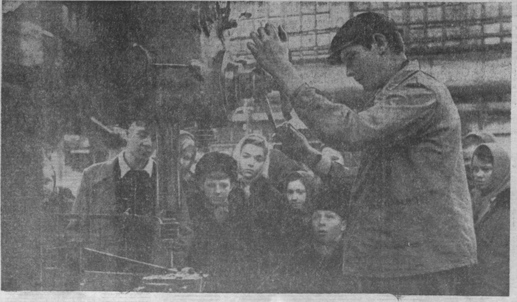
Видные из завода.