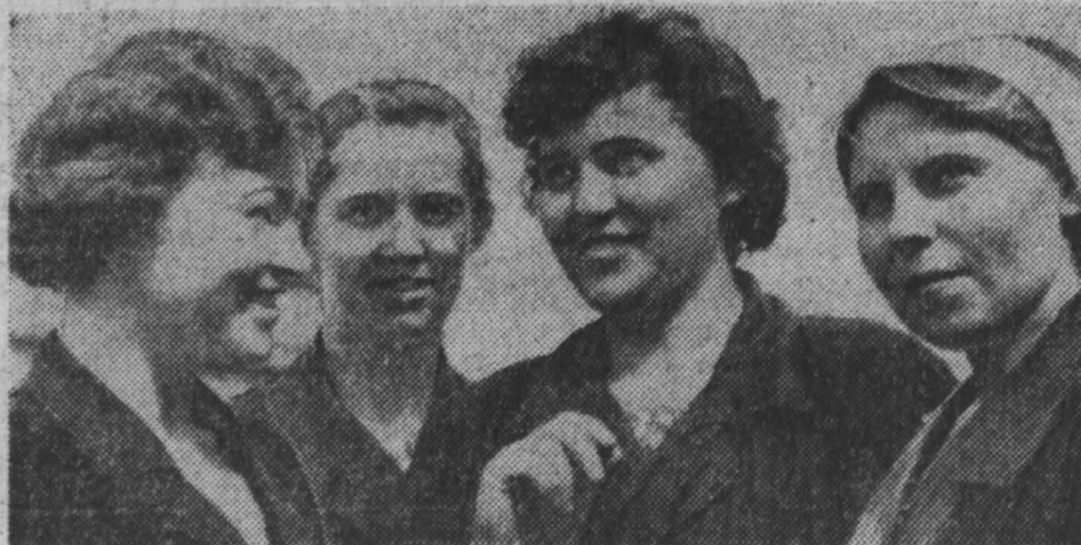
Коллектив сборщиков цеха № 19 на ленинско-кузнецком заводе «Кузбассинструмент» второй год выпускает аккумуляторы для трансисторных приемников. Его продукция идет на многие радиозаводы страны. За последнее время качество выпускаемой продукции значительно повысилось.

В Новокузнецке пройдут собеседования руководителей начальной партийной школы. Здесь будут обсуждены такие проблемы: «Победа социализма в СССР» и «От социализма — к коммунизму».