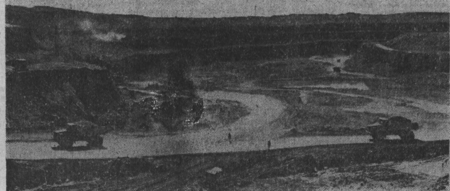
МИРНЫЙ. Летом 1955 года в Якутии было открыто месторождение алмазов. С тех пор прошло десять лет. Советские люди проложили дорогу к трубке «Мир». Сквозь тайгу и болота доставили сюда машины и сложную технику, освоили вышки необжитый край. Начались разработки богатейших запасов ценного минерала. Поток добываемых алмазов из года в год увеличивается.

НА СНИМКЕ: вот как выглядит чаша кимберлитовой трубки «Мир».