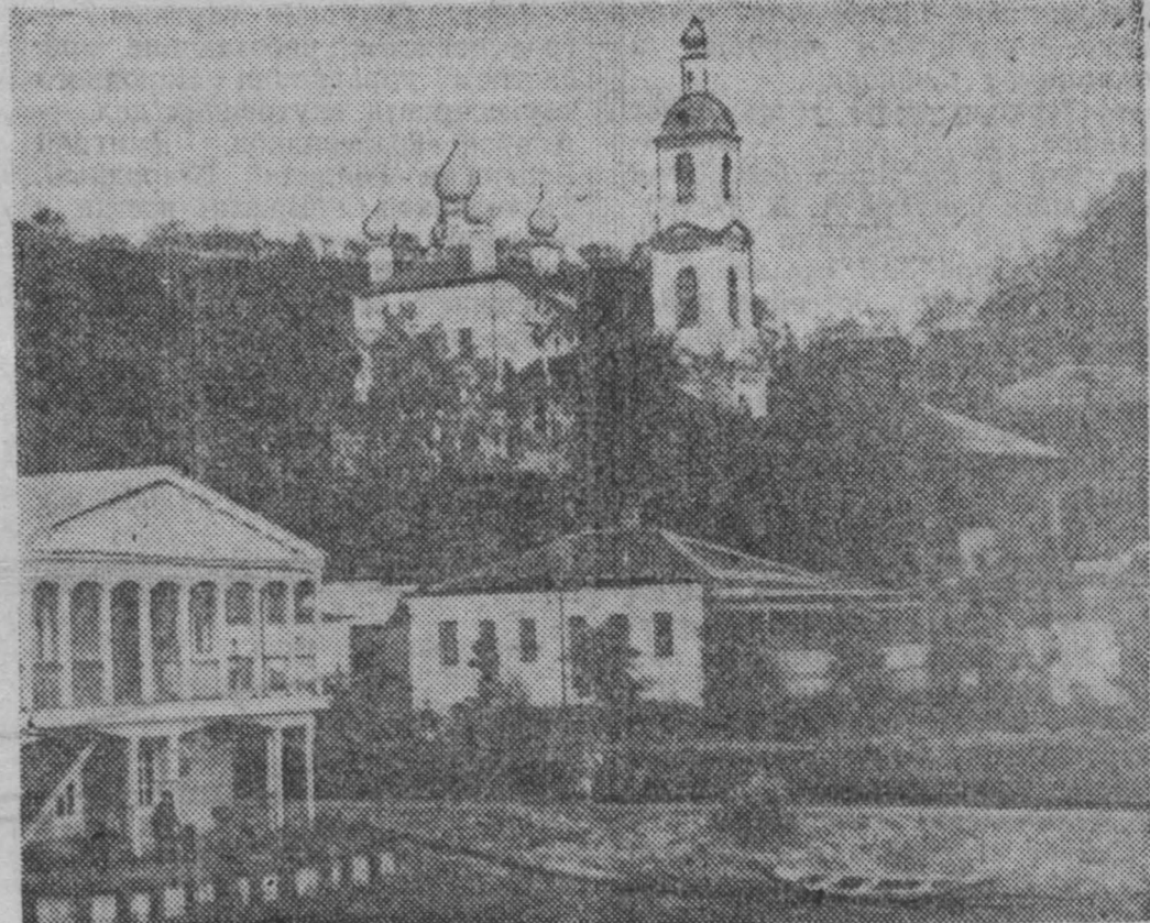
Плес — любимое место художников.

Павел ГРИШАЕВ, корреспондент ТАСС. Пхеньян.