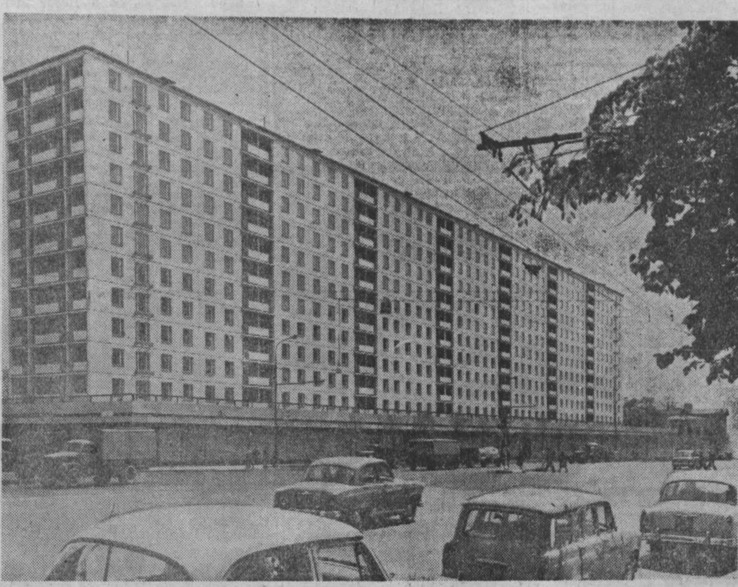
МОСКВА. С оценкой хорошо приняла государственная комиссия новый двенадцатитетяжный дом на улице Чкалова. В здании, построенном из вибропрокатных панелей, 321 квартира. Каждая панель рассчитана сразу на две комнаты. Благодаря этому время монтажа сократилось вдвое. Панели не приваривались одна к другой, а крепились болтами — это точнее и надежнее. Вальс фасада здания протнулись стальные витрины магазинов. Изысканно в доме удобно расправлены, полы устланы новым линолеумом, большие окна пропускают много света и солнца. НА СНИМКЕ: новый дом на улице Чкалова.