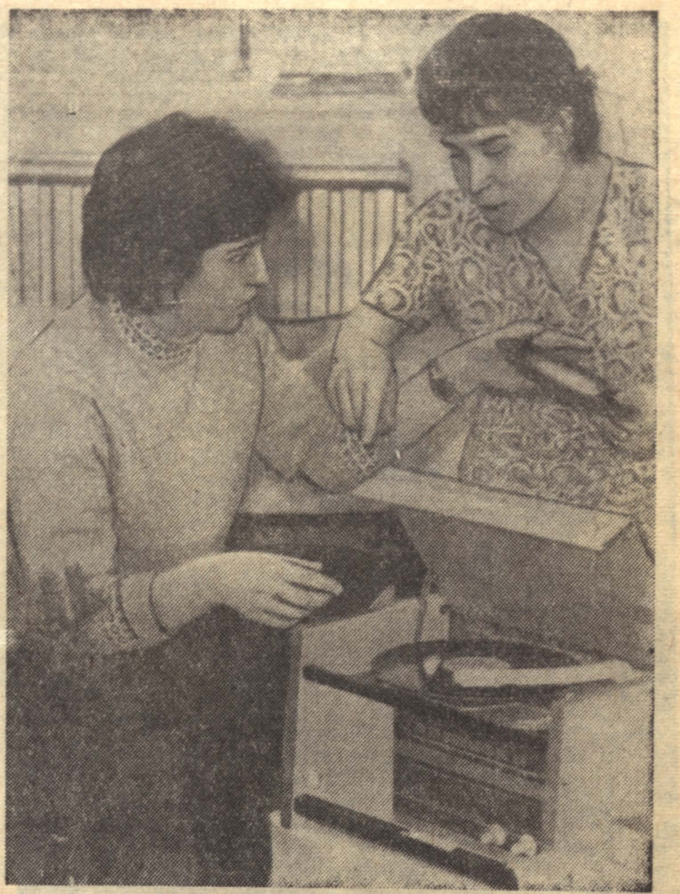
Редакция горячо поздравляет всех активистов газеты и читателей с Новым годом.