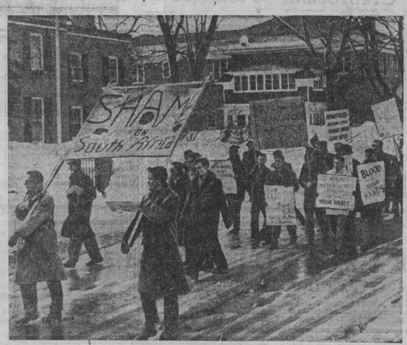
Канадская молодежь осуждает политику апартеида, проводимую правительством Южно-Африканской Республики. В ряде крупных городов Канады произошли студенческие демонстрации протеста. НА СНИМКЕ: демонстрация студентов Оттавского университета. Плакаты гласят: «Позор Южной Африке!», «Нет гражданским правам. Есть убийства и нет правосудия», «Объединенные нации должны вмешаться и уничтожить апартеид».

косновенности тысячам бывших гитлеровских преступников. В статье содержится призыв к итальянскому парламенту и правительству потребовать от властей Западной Германии наказания участников фашистских преступлений в Италии.