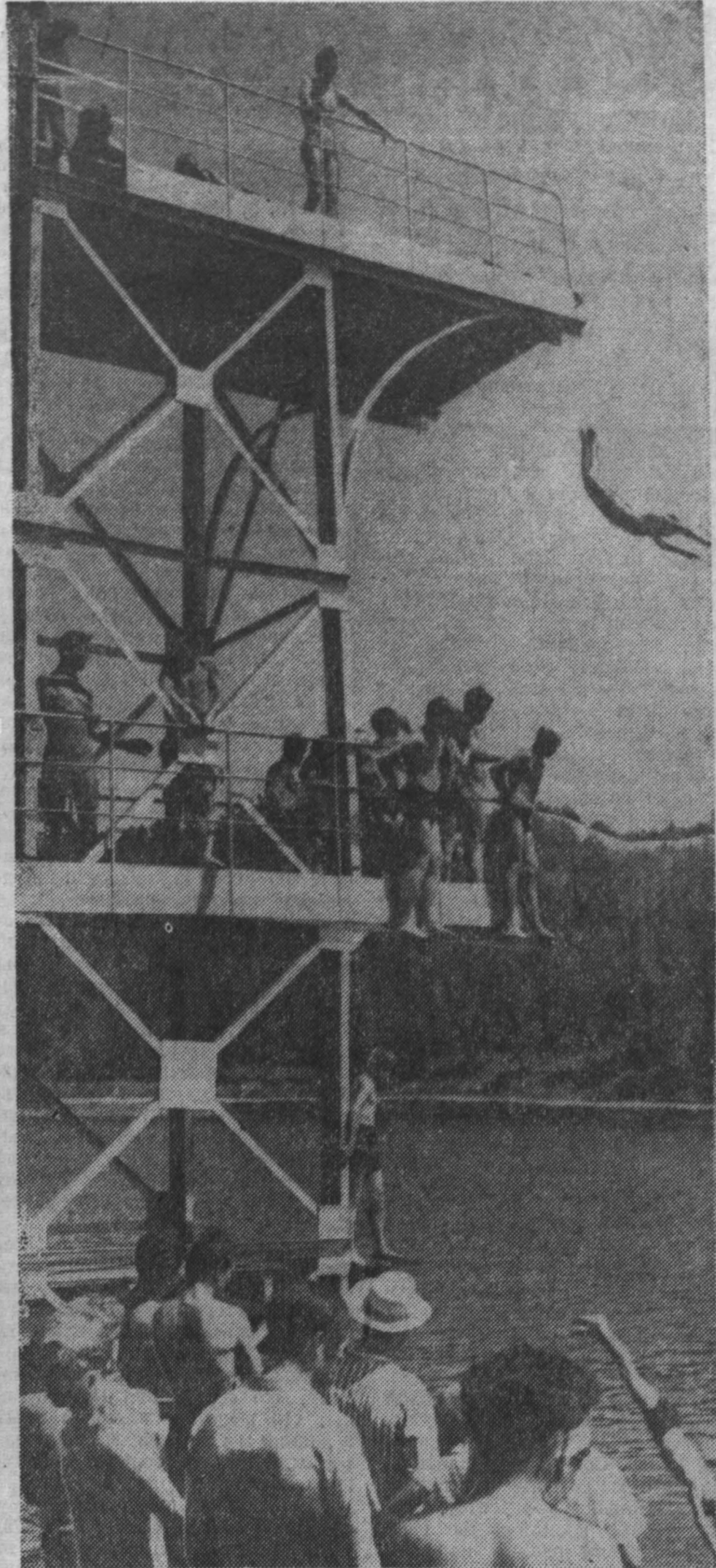
Купальный сезон в разгаре. В Зяновском парке.

А вот результаты остальных встреч команд той же подгруппы второй группы класса «А»: «Аравит» (Ереван) — «Динамо» (Ленинград) — 3:1, «Жальгирис» (Вильнюс) — СКА (Новосибирск) — 3:1, «Ростсельмаш» (Ростов-на-Дону) — «Даугава» (Рига) — 2:1. Таких образом, во вторник всюду успех сопутствовал хозяевам поля. (ТАСС).