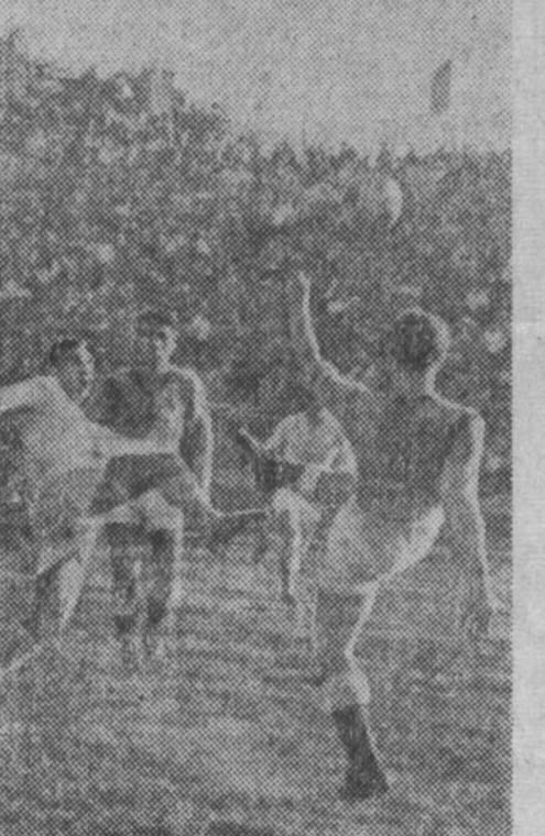
Воспитанники «Сибсельмаш» на своем поле отоборал оба очка у торпедовцев Томска (1:0), а команда «Авангард» из Комсомольска-на-Амуре нанесла поражение иркутской «Ангаре» — 2:1.

А вот как закончились другие воскресные матчи команд класса «Б» шестой зоны. В трех случаях зафиксирована ничья: «Армеец» (Улан-Удэ) — «Луч» (Владивосток) — 2:2, со счетом 1:1 закончились встречи команд «Локомотив» (Красноярск) — «Амур» (Благовещенск) и «Темп» (Барнаул) — «Забайкалец» (Чита). Но-