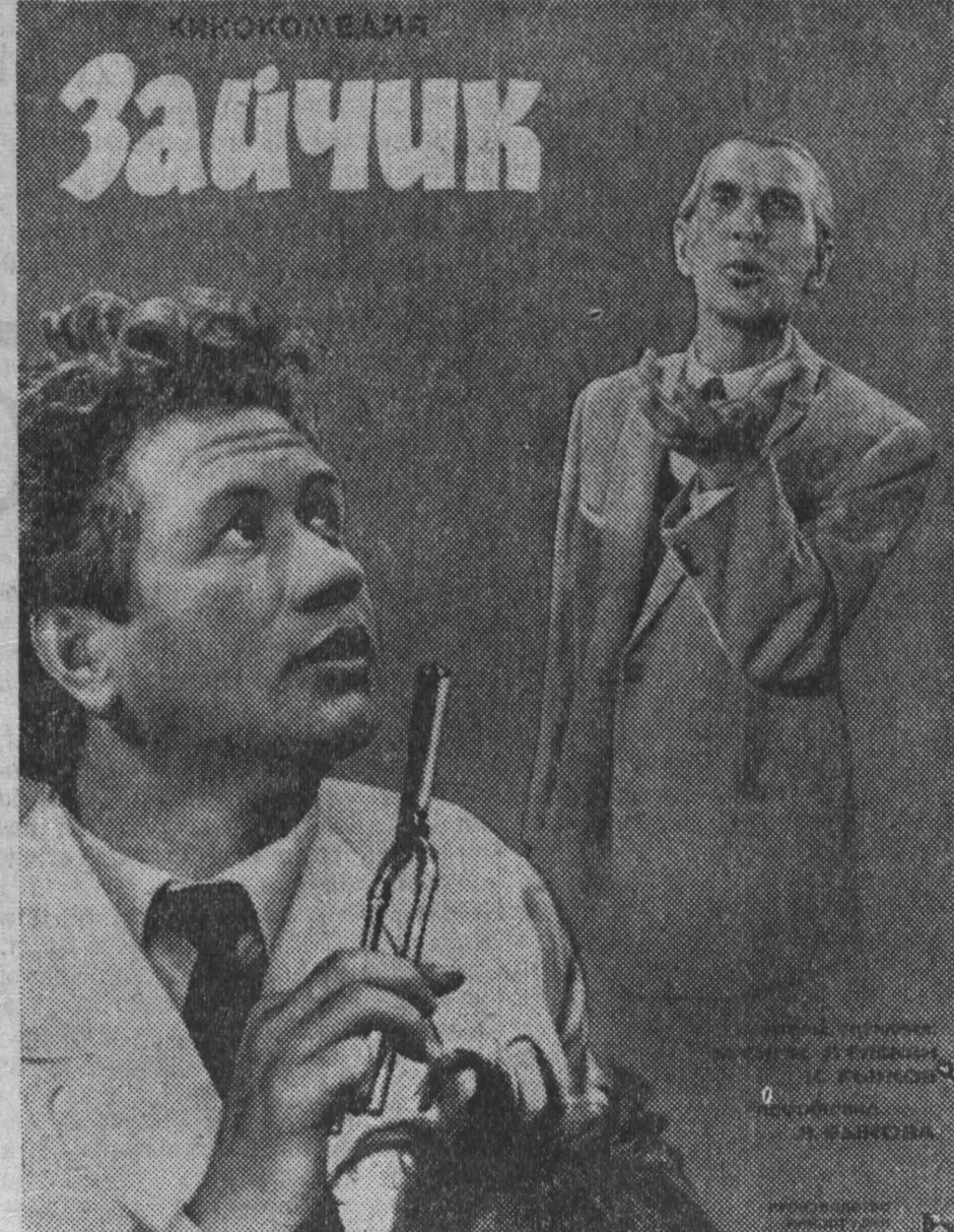
В постановке Леонида Быкова. Производство киностудии «Ленфильм».