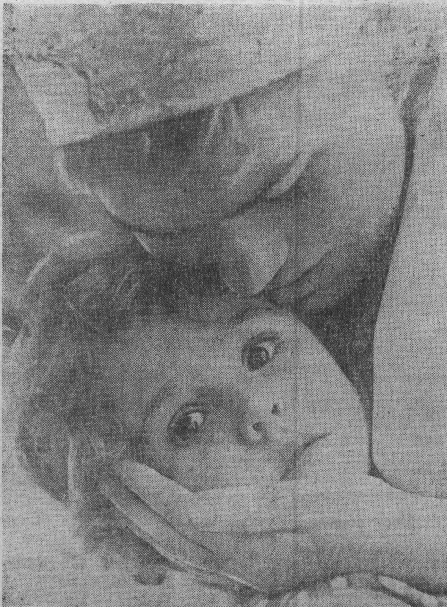
Расти, моя доченька!