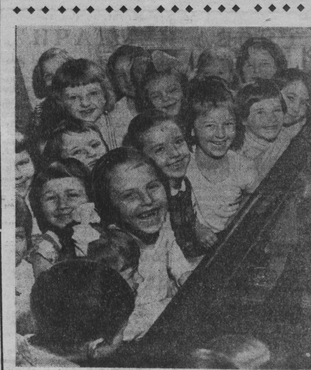
Польская Народная Республика — страна счастливого детства. Подростающему поколению здесь предоставлено все самое лучшее — школы и стадионы, детские площадки и ясли, дома культуры и санатории.

Норвегия высказалась против своего участия в планировании многосторонних ядерных силах НАТО. В норвежских правящих кругах, судя по сообщениям печати Осло, появилась тенденция к пересмотру своего отрицательного отношения к предложениям о создании в Европе зоны свободной от ядерного оружия. Следует отметить, что для развития экономических связей между СССР и Норвегией пока еще используются далеко не все возможности. Например, на долю СССР и других социалистических стран приходится лишь около 3 процентов внешнеторгового оборота Норвегии. В настоящее время хозяйственные органы обеих стран изучают возможности более широкого экономического сотрудничества. Существенное значение в разрешении этой задачи должно сыграть прошлогоднее соглашение о торговле между северными районами Норвегии и СССР. Положительным оказался и опыт советско-норвежского экономического сотрудничества по использованию гидроэнергетических ресурсов пограничной реки Пасвик, где в прошлом году норвежская фирма закончила строительство Борксотгелбской электростанции. В прошлом соседство Норвегии и Советского Союза не раз служило на пользу обоим странам. Продолжению этой доброй традиции будет способствовать нынешний визит в СССР норвежского премьер-министра Э. Герхардсена. П. РЫСАКОВ (ТАСС).