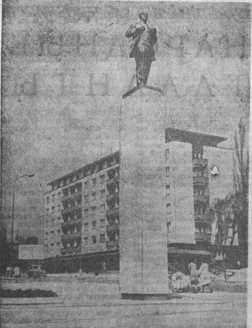
Памятник В. И. Ленину, открытый недавно в городе Млада-Болеслав (Чехословакия).

Американский журнал «Медицинский журнал» («Новости медицинского мира») сообщает, что «медицинские шарлатаны» в США унесли больше жизней, чем все другие преступники, вместе взятые. Жертвами его чаще всего оказываются пожилые люди.