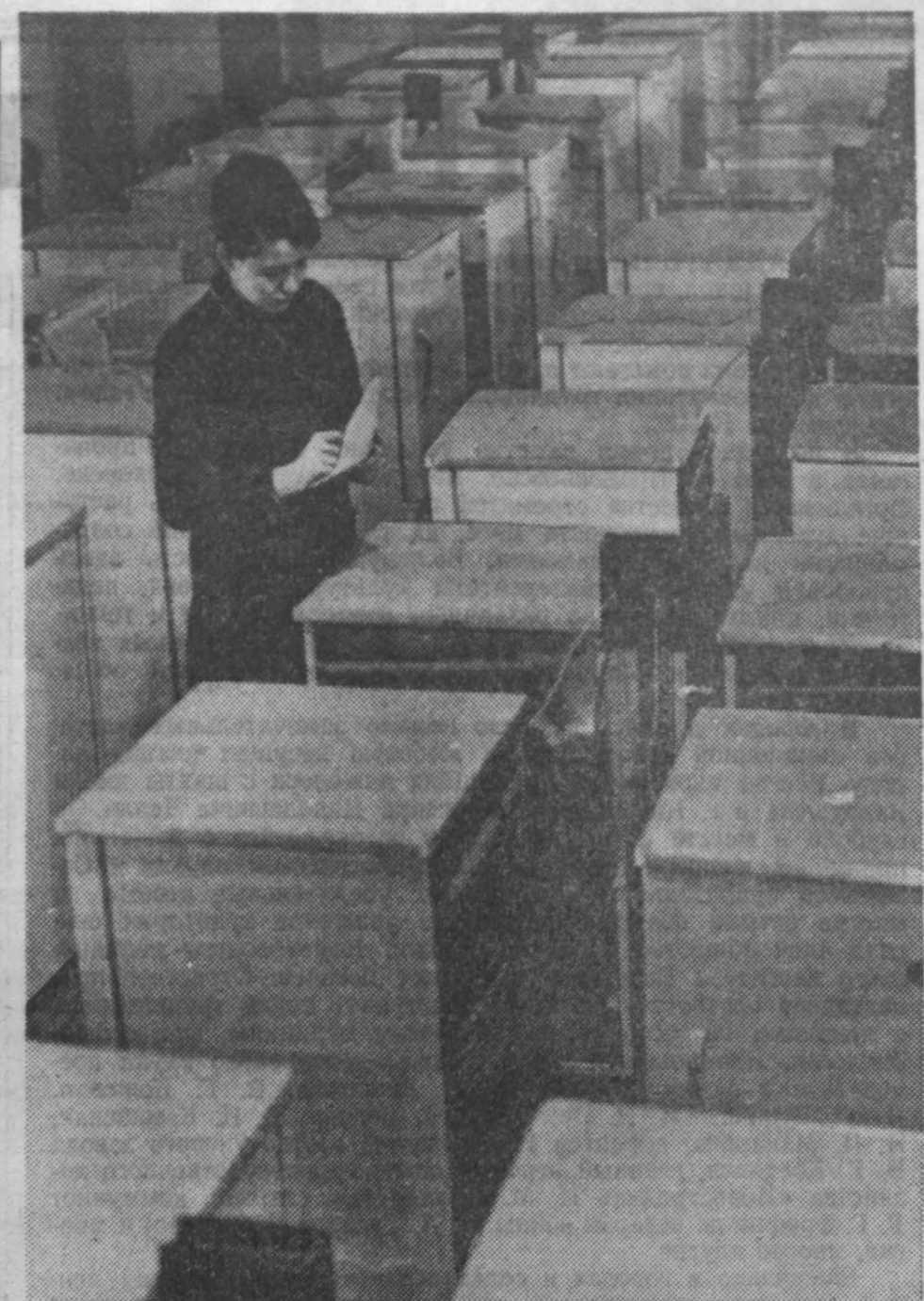
Рядом стоят холодильники с маркой «Кубзасс». Эту продукцию прокопьевского завода «Электротрактор» можно увидеть во многих уголках нашей Родины, в ВДНХ. Сейчас коллектив цеха, который выпускает холодильники «Кубзасс», стремится сдавать продукцию только высокого качества. НА СНИМКЕ: холодильники «Кубзасс» на испытательном стенде.