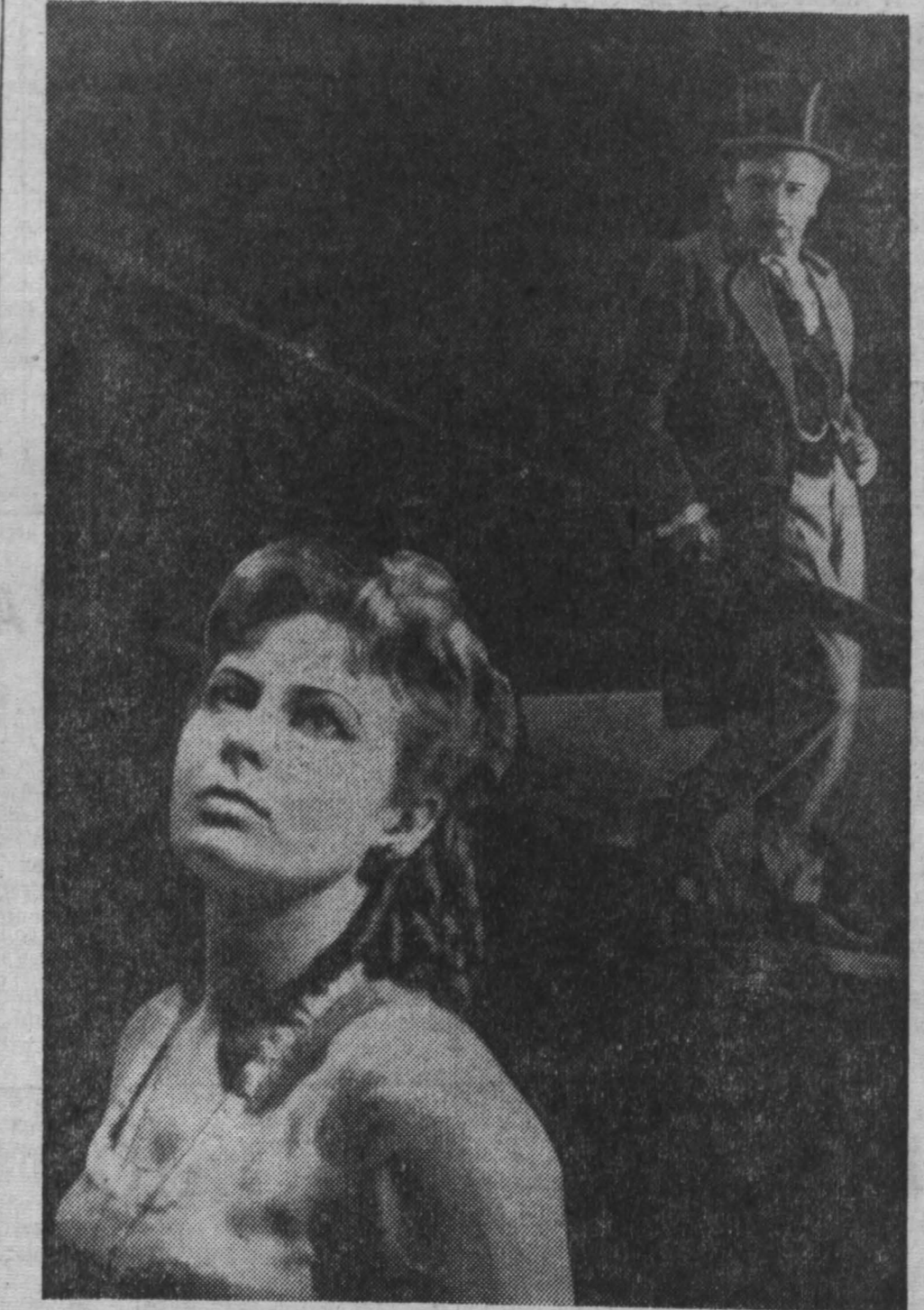
Второй спектакль, с которым познакомил кемеровчан Томский облдрамтеатр, — бессмертная драма А. Н. Островского «Бесприданница».