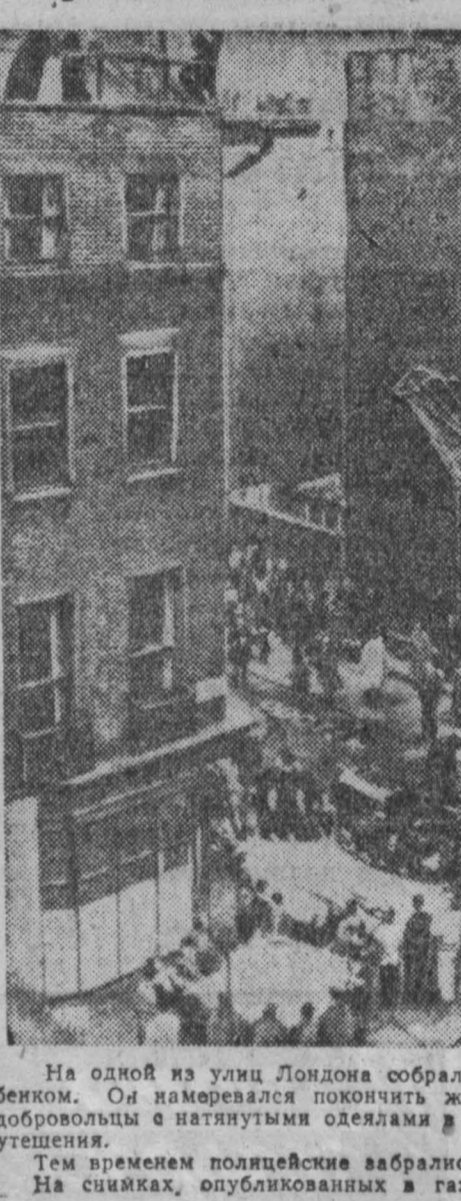
На одной из улиц Лондона собралась большая толпа. На крышу 4-этажного дома забрался мужчина с двухлетним ребенком. Он намеревался покончить жизнь самоубийством. К зданию были доставлены пожарные лестницы. У дома стояли добровольцы с натянутыми одеялами в руках, надеясь поймать несчастного. Его уговорили спрыгнуть, крича снизу слова утешения.

НИКОЗИЯ, 26 марта. (ТАСС). На Кипр продолжают прибывать войска ООН, на сегодняшний день на Кипр прибыло 948 солдат и офицеров, которые войдут в состав объединенных вооруженных сил ООН на Кипре. Сегодня ожидается прибытие первой группы офицеров Финляндии. Первые группы из Швеции и Ирландии должны прибыть завтра.