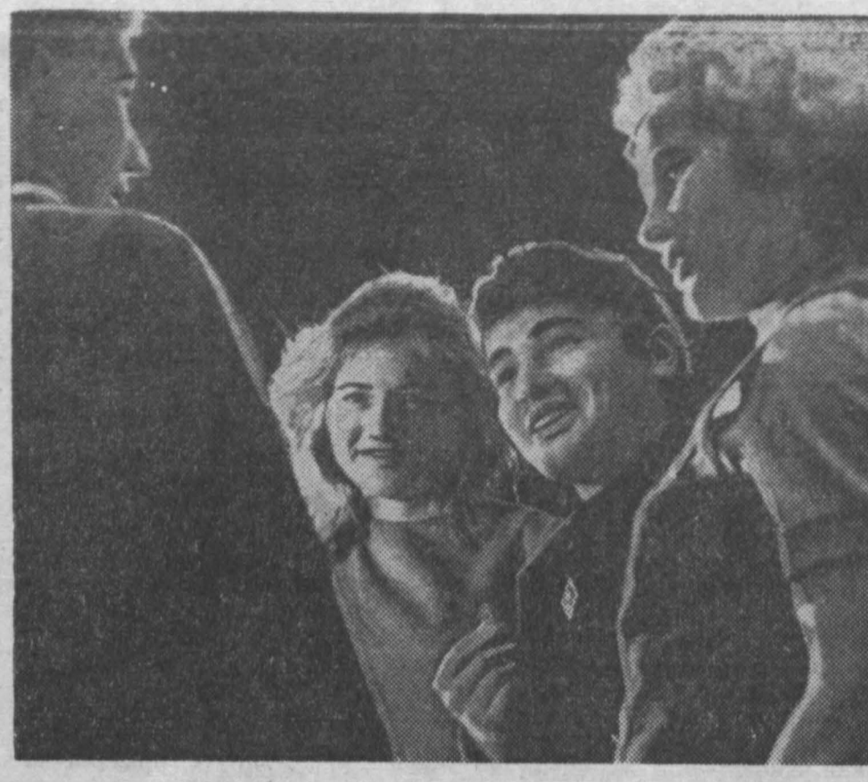
Большим авторитетом пользуется у сельских зрителей Тихвинский народный театр. Медведи на сцене театра становятся спектаклем «Если любишь».

Как мы уже сообщали, матч армейцев Хабаровска с кемеровским «Шахтером» закончился их победой. Вот как прошла игра. Матч проходил в острой спортивной борьбе.