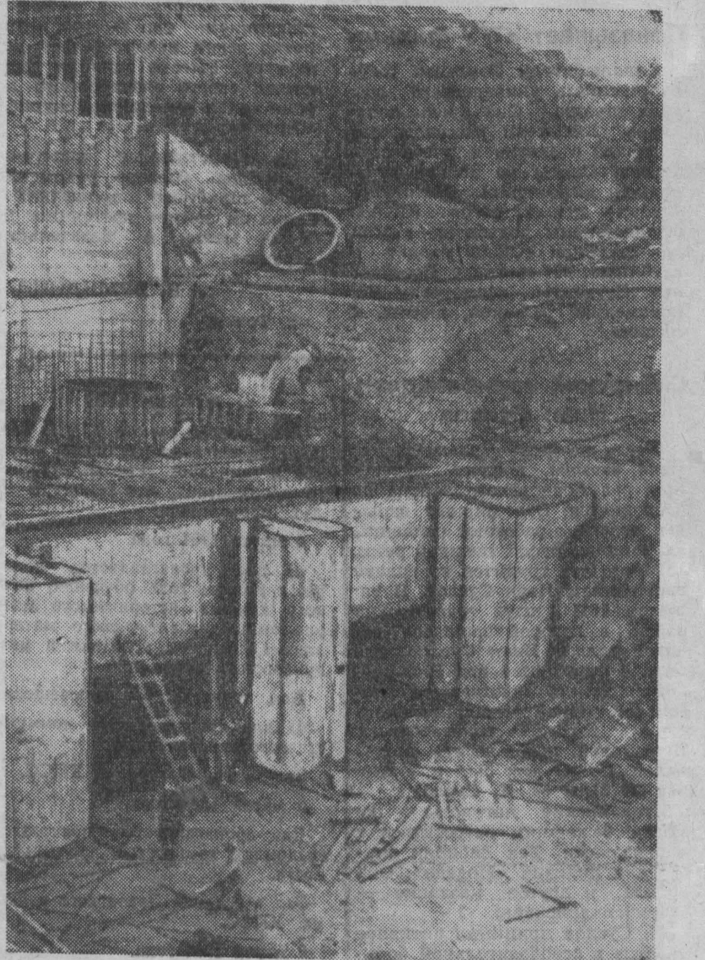
В Афганистане в районе города Джелал-Абад с помощью Советского Союза вступил в строй канал и гидроэлектрический комплекс, 70-километровый главный канал имеет устойчивость к напору воды в 30 тысяч гектаров.

моса, нужно переписать, убыстрить речь в восемь раз до нормальной скорости. Наушники передаются переводчику. Выключены все приборы. Тишина. — Я — Джодрелл Бенк, — медленно произносит он. Еще дважды английские передачи передавал в космос одну и ту же фразу. Отраженные спутником «Эхо-2», сигналы принимались в Зименках постепенно, все отчетливее прояснялись их содержание. Для контроля английские специалисты передали по обычному телеграфу содержание телеграммы, переданной через космос. «Я — Джодрелл Бенк (Англия)», — говорилось в ней, — вызывающий Зименки через спутник «Эхо-2». Всего 11 английских слов, из которых советским ученым удалось разобрать восемь, остальные утонули в космическом шуме. Поздно вечером состоялась речевая передача на русском языке. При первом прослушивании магнитофонной записи удалось разобрать три слова: «Привет», «Джодрелл Бенк», «Передаем». Началась детальная обработка передачи. Международный космический эксперимент продолжается.