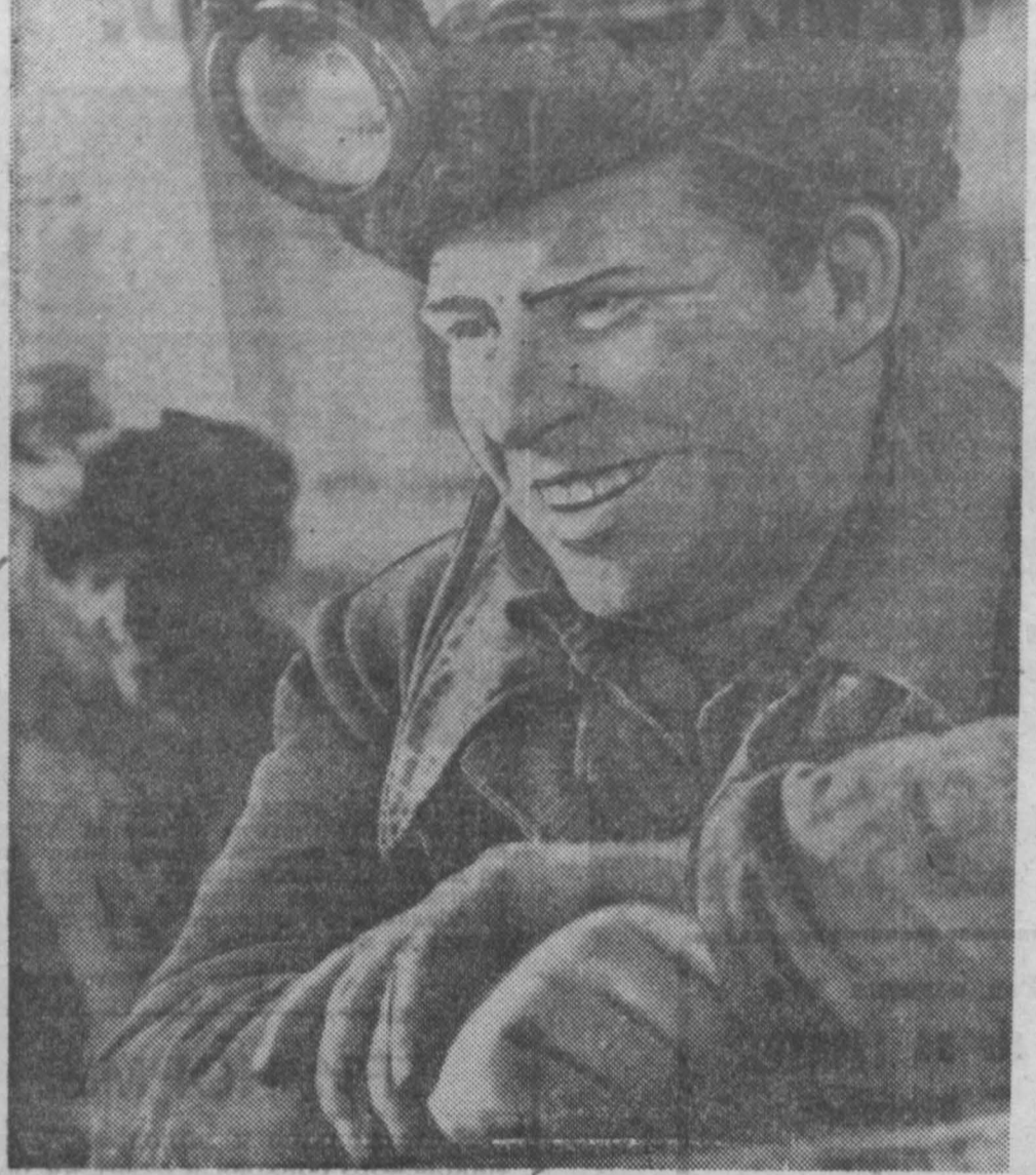
Около трех тысяч тонн сверхпланового угля выдали нагтора с начала года горняки шахты «Байдаевская». Вместе с взрывниками, проходчиками и забойщиками производительно трудится в эти дни коллектив участка подземного транспорта.

В лаборатории Института обогащения и механической обработки полезных ископаемых обратились к опыту Датского медного рудника. Оказалось, что микроорганизмы могут перенести в водорастворимую форму токсичные металлы.