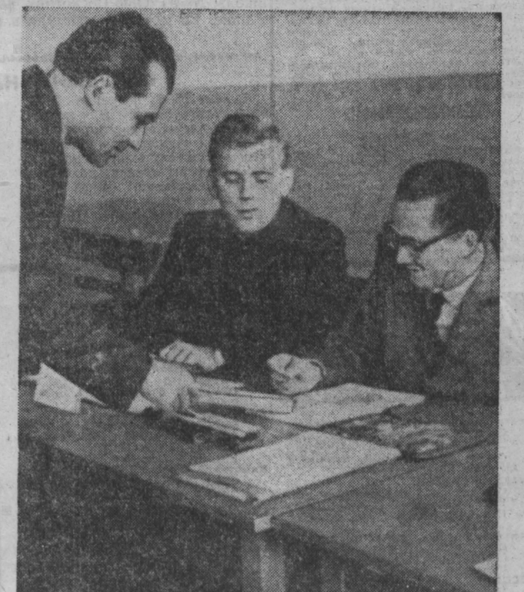
Более 60.000 человек перешло за последние три года из Западной Германии в Германскую Демократическую Республику. Неустрашимость в завтрашнем дне, угроза безработицы, нежелание служить в агрессивном бундесвере заставляют их бежать из боннского «рая».