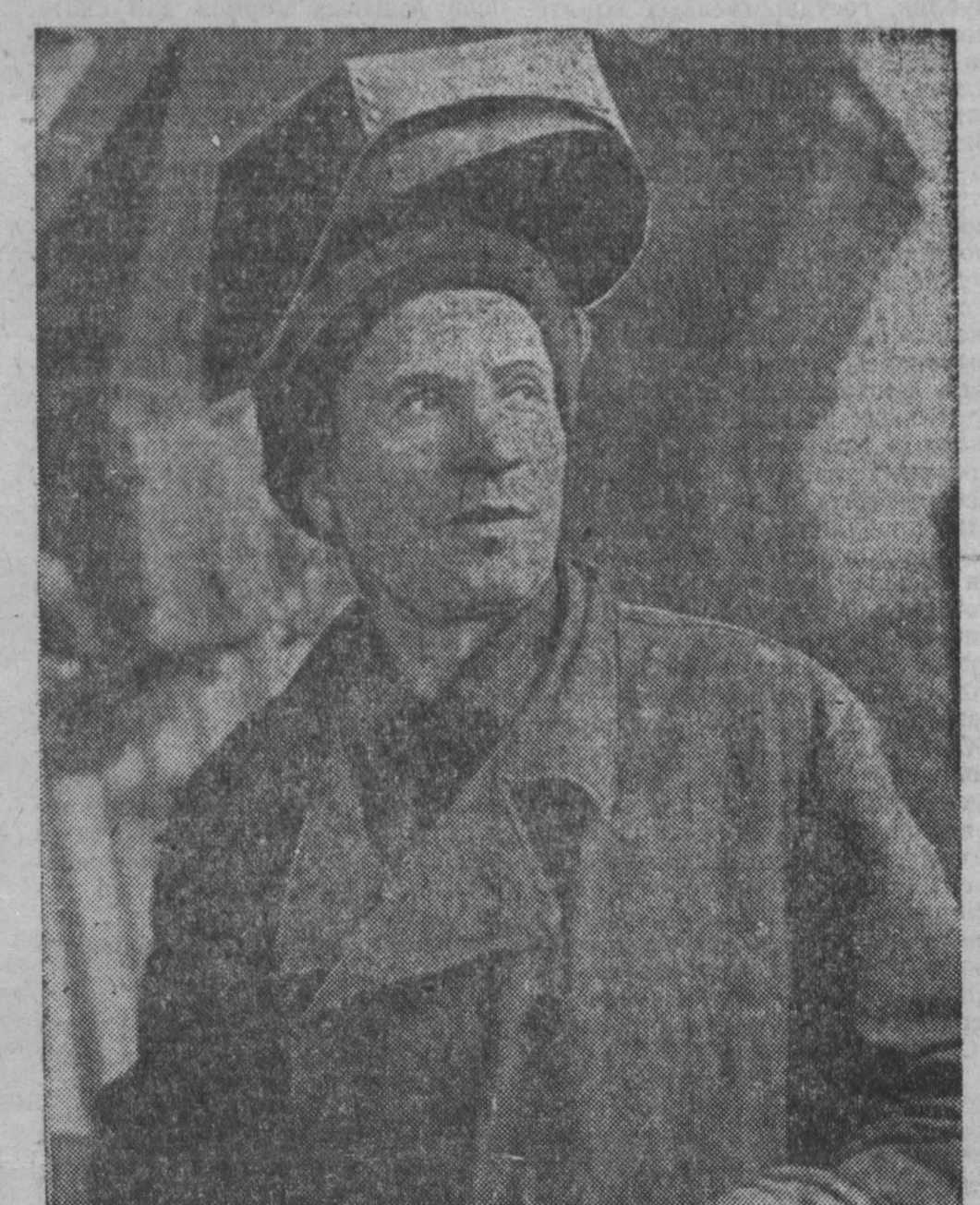
Летят голубые искры. Шов ложится быстро и ровно. Нужно срочно закончить сварочные работы на котельной шахты «Физкультурник»