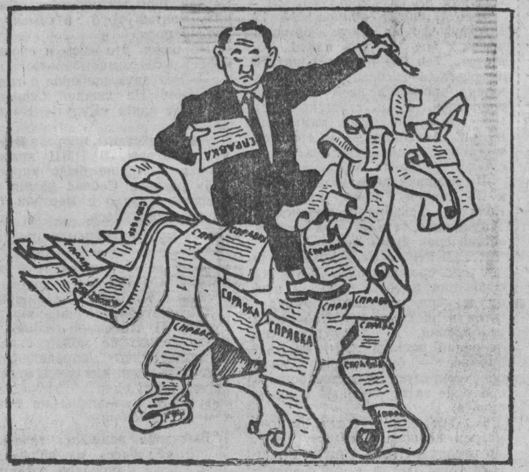
Рис. Е. СМЕРНОВА.

Это, как видите, относится и к тем, кто требует, и к тем, кто составляет. П. ГУЛЫЙ.