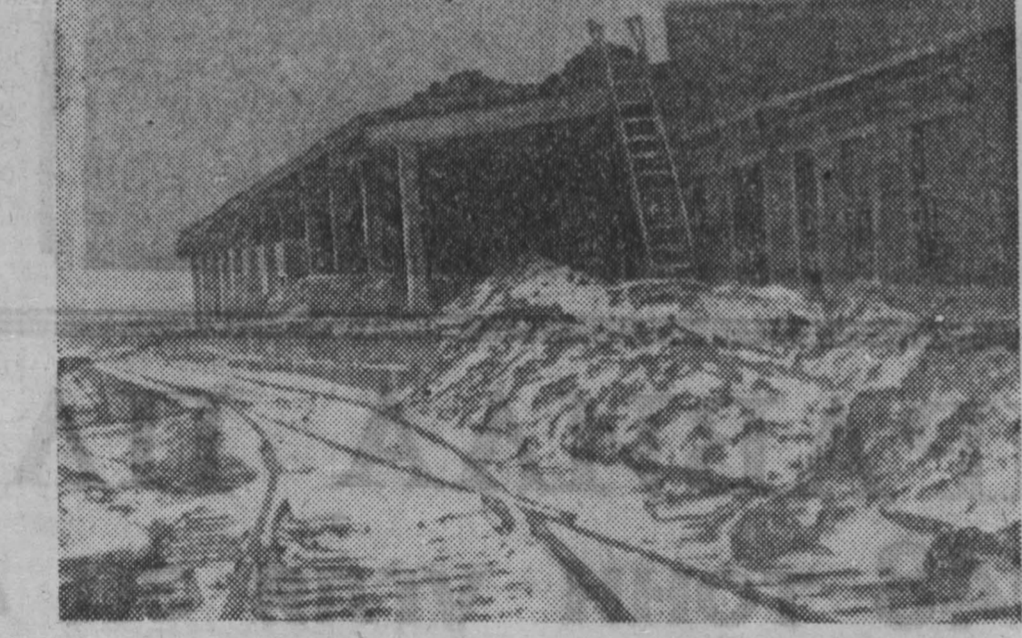
Строительство продовольственной базы орс треста «Ленинголь».