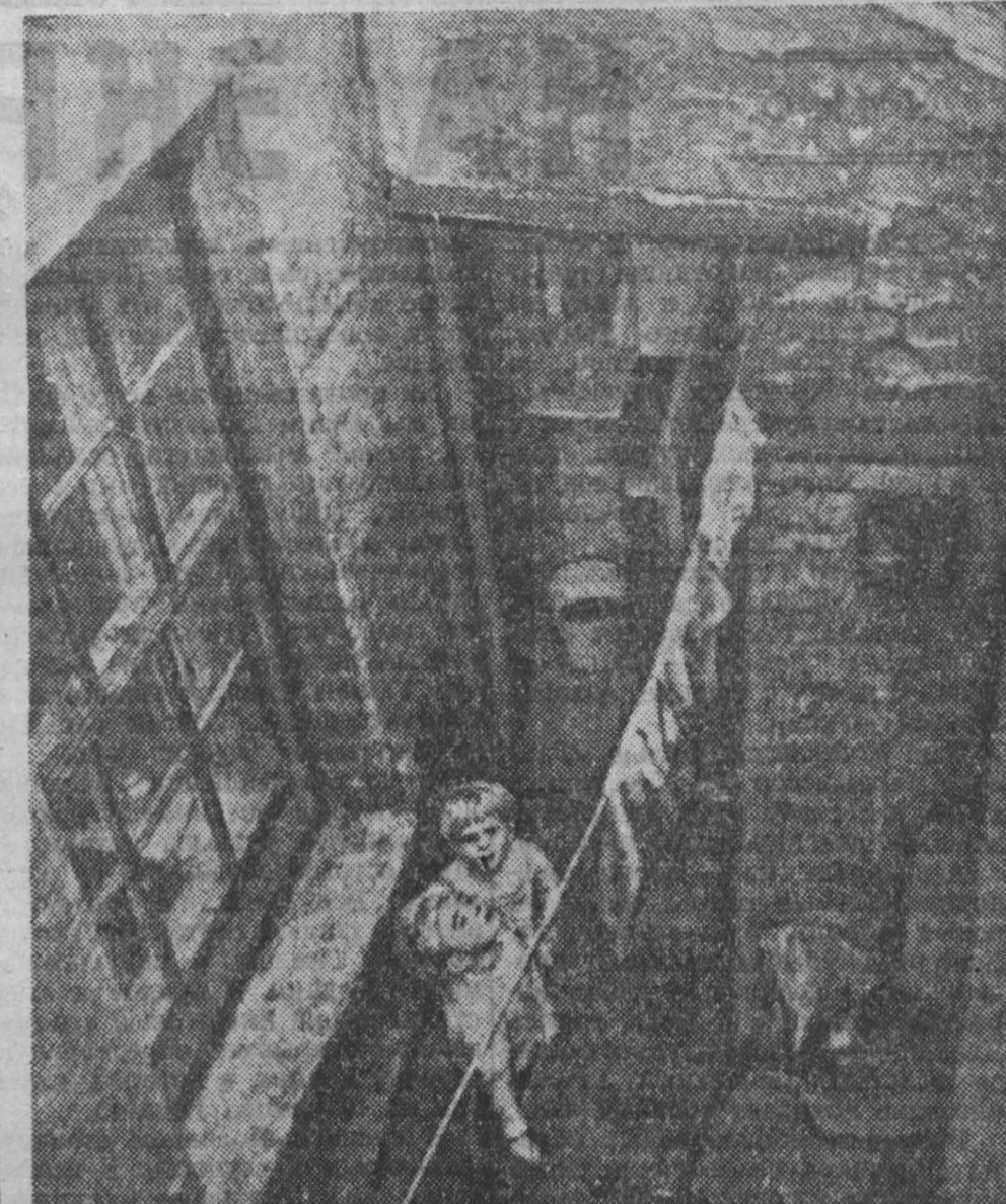
Этот снимок помещен в английской газете «Дейли мэрриор». Фоторепродукция посетил район трущоб в городе Ливерпуле...