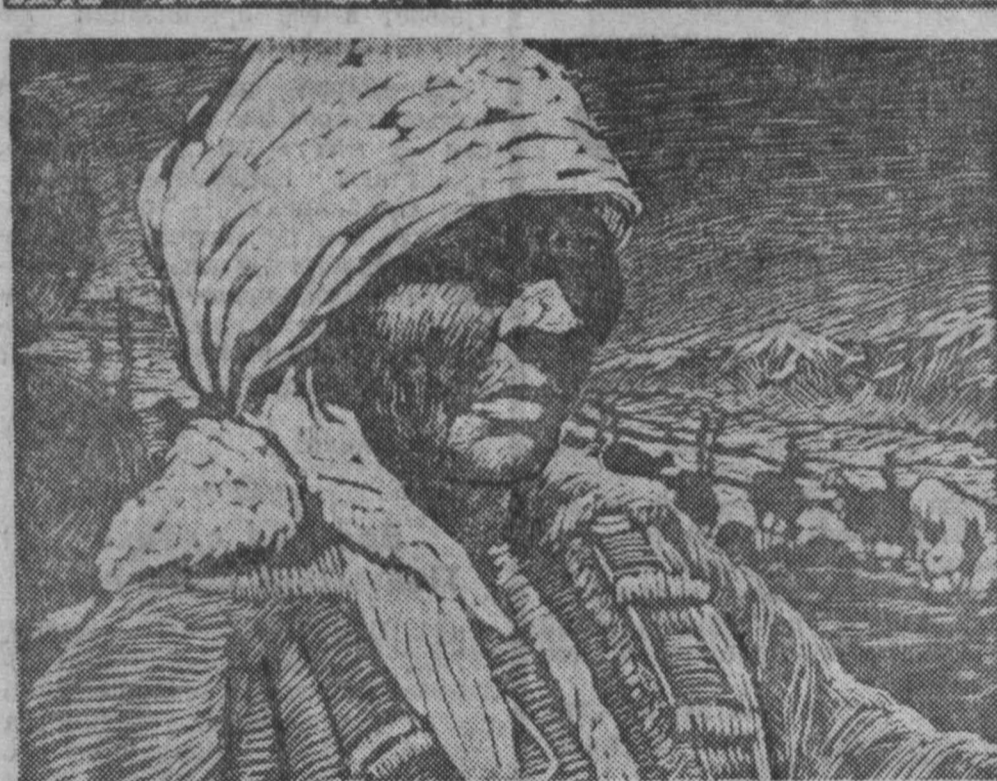
НА СНИМКАХ (сверху вниз): Р. Берг «Перед открытием кафе», А. Гордеев «Шальский рудник», А. Ананьев «Чабан».