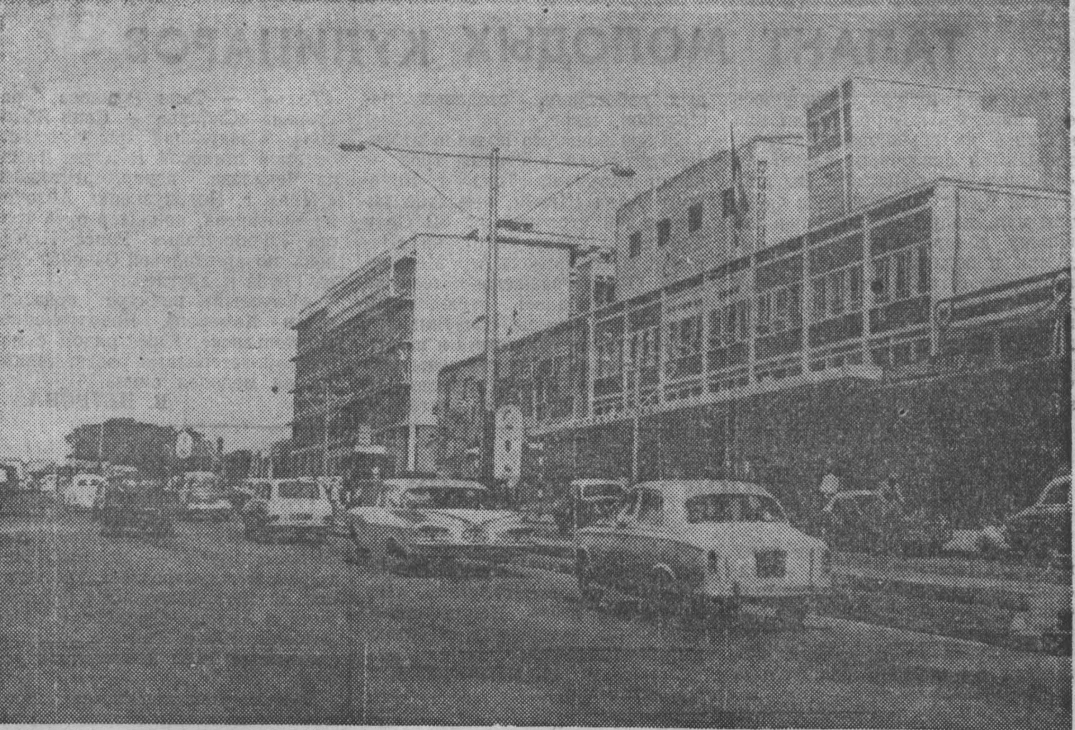
Молодой человек на улице в городе Кампала — столице Уганды — молодой африканской республике.