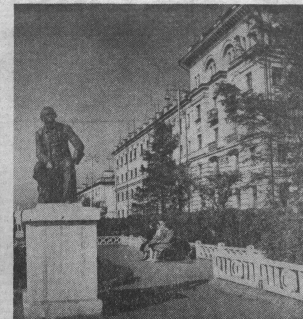
Один из любимых уголков жителей города Ленинска-Кузнецкого — проспект М. Ломоносова.