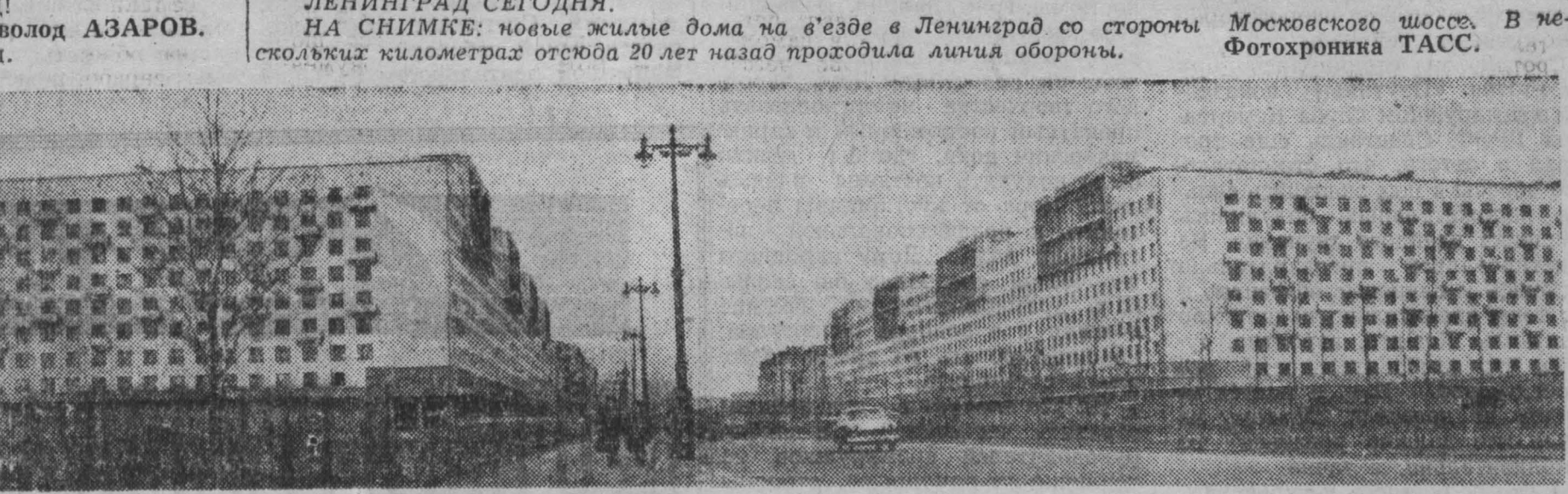
Московского шоссе. В нескольких километрах отсюда 20 лет назад проходила линия обороны.