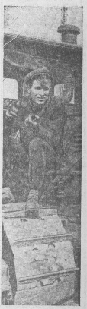
НА СНИМКЕ: ПЕТР БУЛАТОВ.