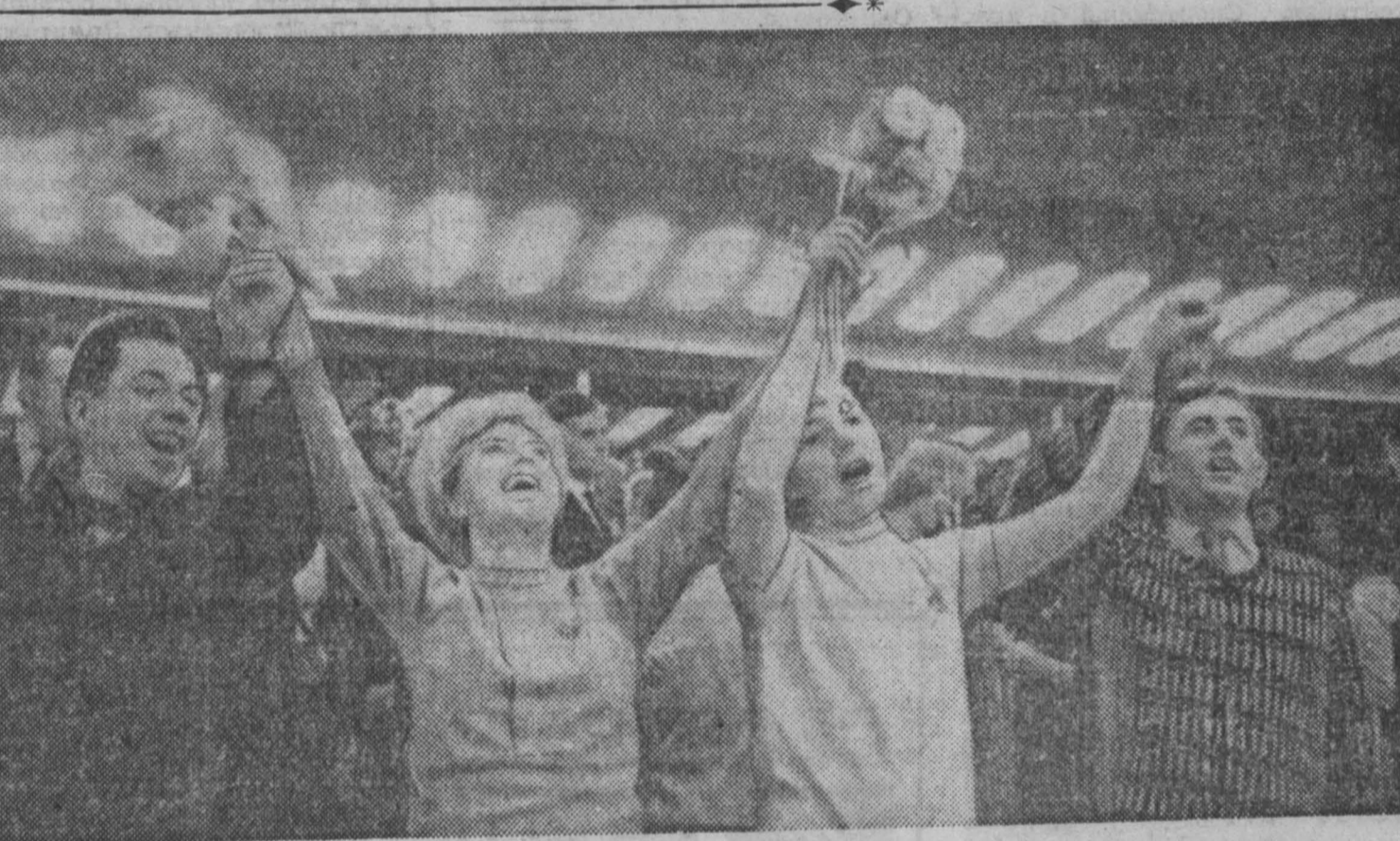
В зале заседаний Всемирного форума молодежи и студентов в борьбе за национальную независимость и освобождение, за мир.