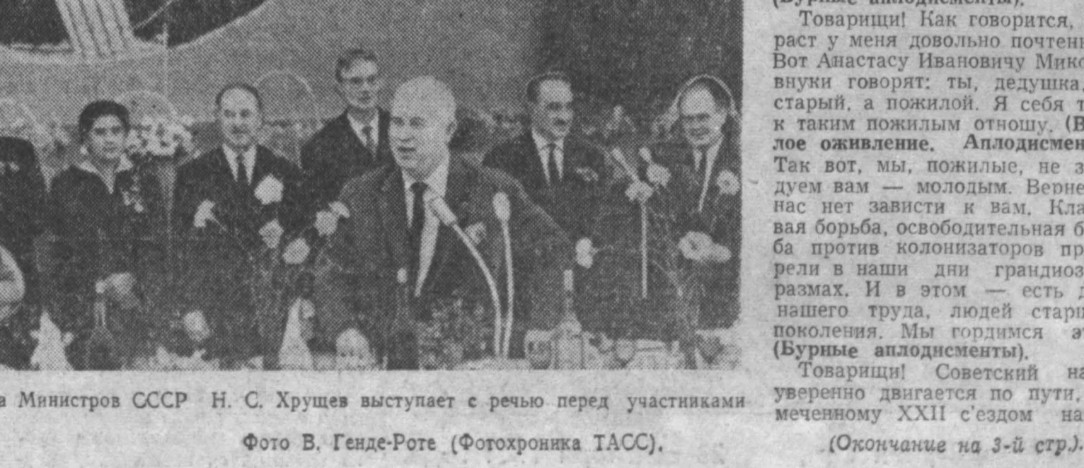
На снимке: Председатель Совета Министров СССР Н. С. Хрущев выступает с речью перед участниками форума и гостями.

Центральный Комитет Коммунистической партии Советского Союза, Президиум Верховного Совета СССР и Совет Министров СССР с глубоким прискорбием извещают партию и всех трудящихся Советского Союза, что 21 сентября 1964 года в 12 часов 35 минут в Берлине после продолжительной и тяжелой болезни на 71-м году жизни скончался выдающийся государственный и партийный деятель Германской Демократической Республики, член Политбюро Центрального Комитета социалистической Единой партии Германии, Председатель Совета Министров ГДР, заместитель председателя Государственного совета ГДР, видный деятель германского и международного рабочего движения, верный друг Советского Союза товарищ ОТТО ГРОТЕВОЛЬ .