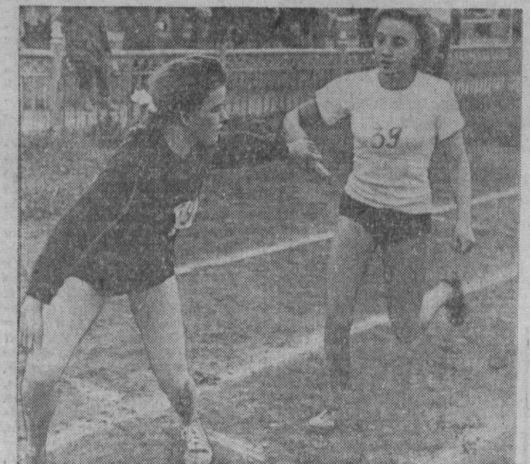
В прошлое воскресенье на стадионе «Химик» была проведена эстафета на приз газеты «Комсомолец Кузбасса». В эстафете участвовали школьники, студенты. Два приза газеты «Комсомолец Кузбасса» завоевали учащиеся школы № 62.