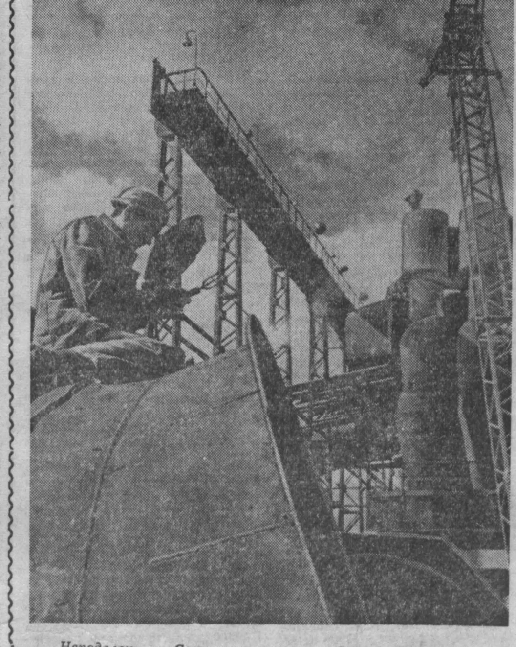
Неподалеку от Соколинских гор, там где проедит железнодорожная трасса на Абакан, развернулось большое строительство — возведение Абаканской фабрики, которые соорудит почти пять тысяч человек. Идет монтаж станков и механизмов. Агломерат жидкой металлизации Сибирского металлургического завода. Пять железнодорожных вагонов агломерата в час — такова производительность будущего гиганта.

Все гусеничные и мощные колесные тракторы — на заба! Доведем прирост пахоты до 50 тысяч гектаров в сутки!