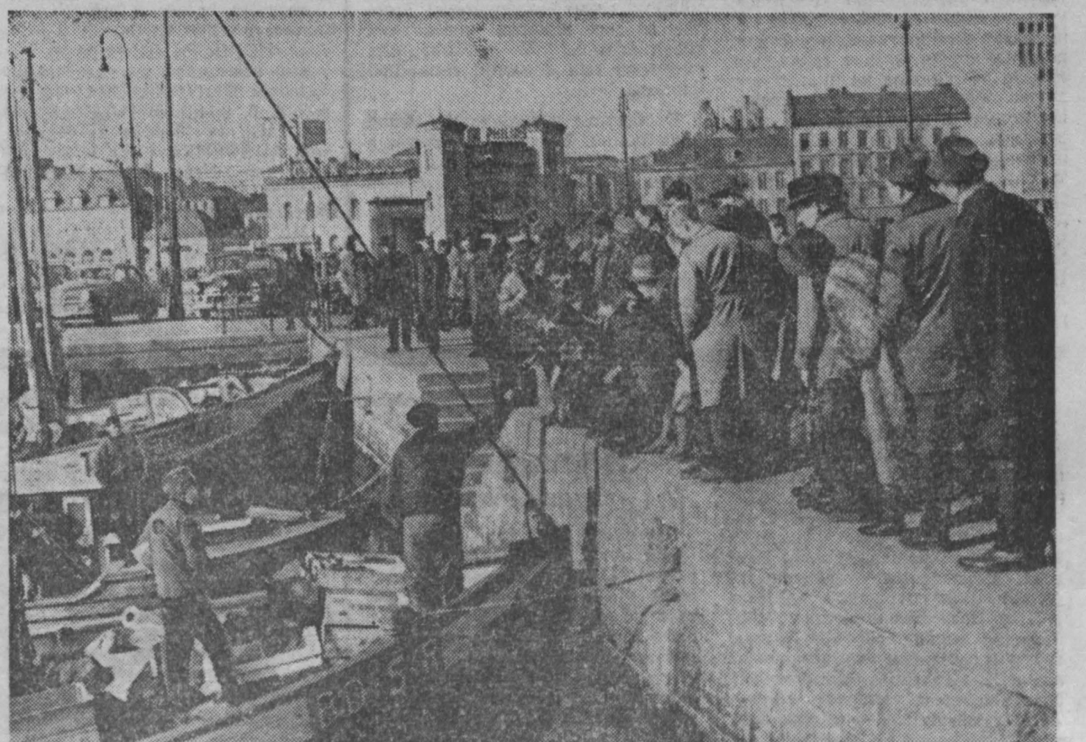
НОРВЕГИЯ. Осло. Торговля креветками на набережной в центре города.