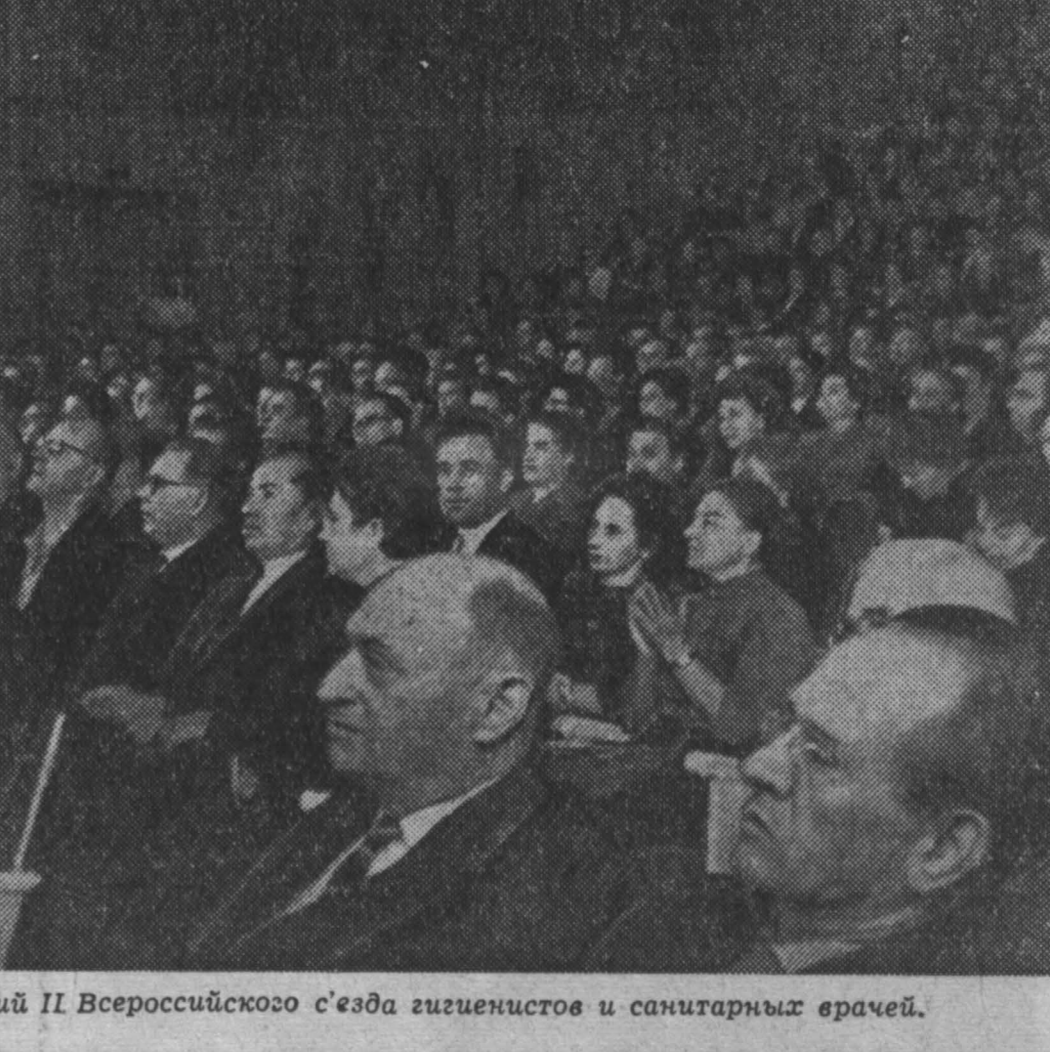
НА СНИМКЕ: в зале заседаний II Всероссийского съезда гигиенистов и санитарных врачей.

СОФИЯ, 8 сентября. (ТАСС). Сегодня утром здесь открылось торжественное заседание юбилейной сессии Народного собрания Народной Республики Болгарии. Сессия посвящена 20-й годовщине социалистической революции в Болгарии.