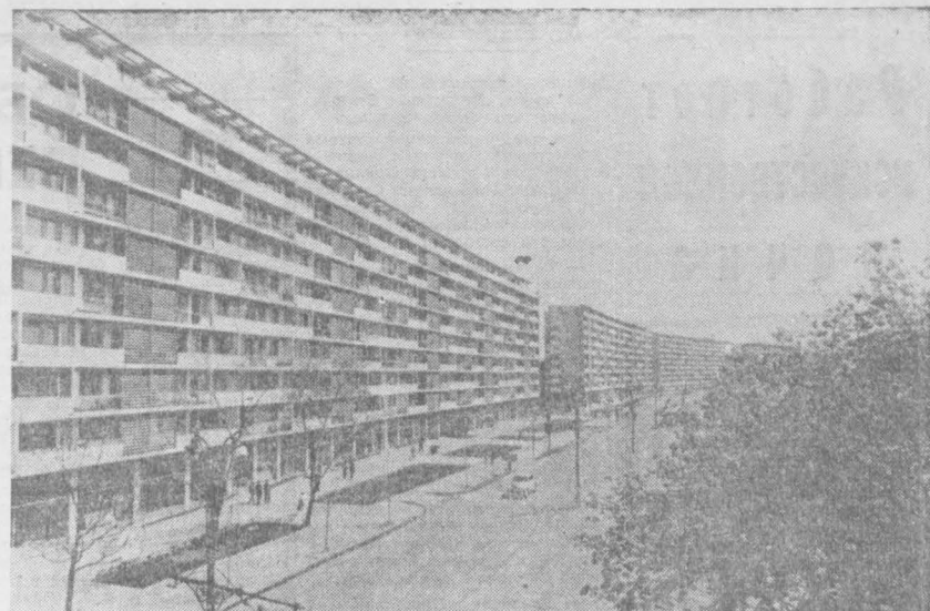
За последние четыре года за счет государственных фондов в Румынии построено 161.800 квартир. За этот же период населением сельской местности построено на собственные средства 383 тысячи квартир.