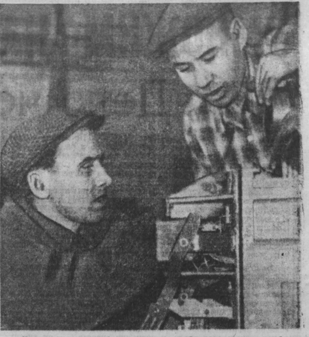
Кемеровские машиностроители готовят новое оборудование для угольной промышленности. Коллектив экспериментального цеха завода «Кузбассэлектромотор» начал собирать опытный вариант взрывозащитных пускателей ПВИ-4.

ков в 2,5 раза. Удельные капиталовложения при этом снижаются с 300 до 130 рублей/Кемеровские азотки оставили технико-экономический расчет, по которому мощность завода увеличивается в два раза.