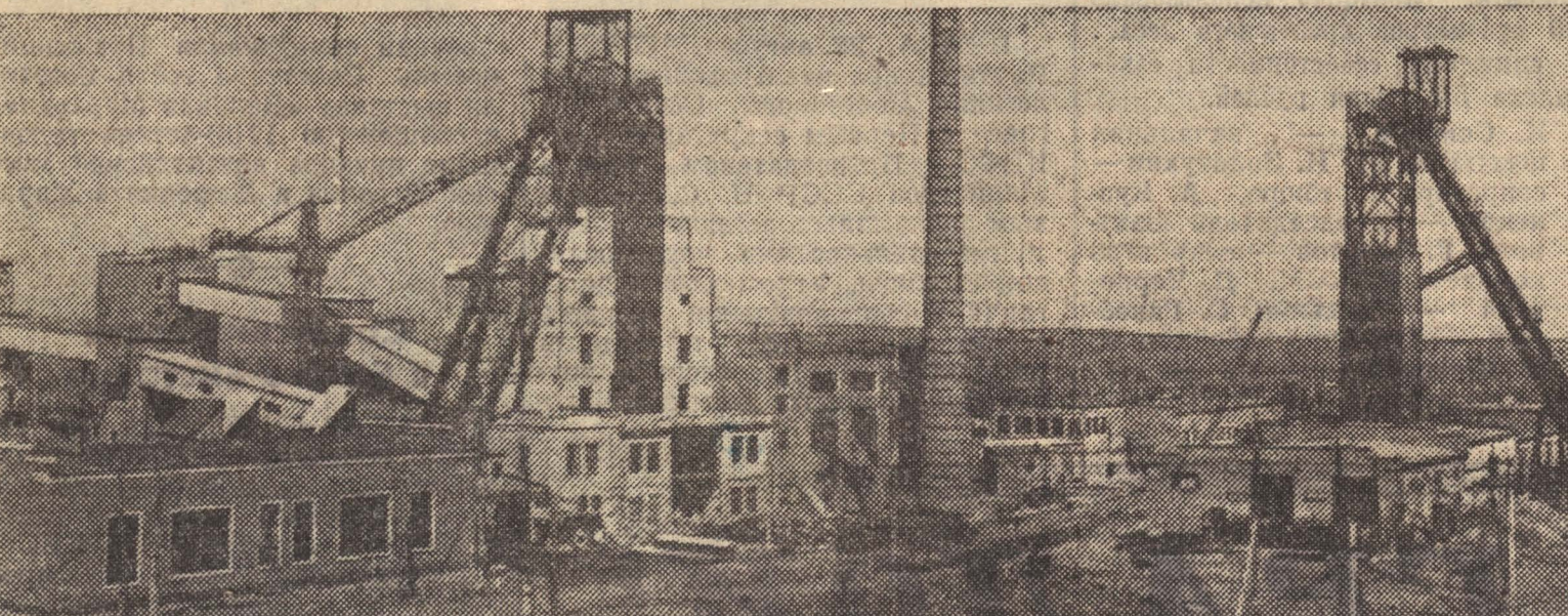
Вот она, шахта-красавица!