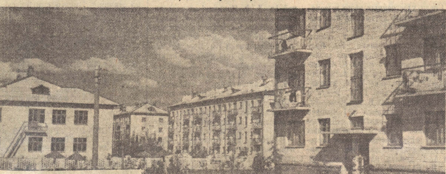
Здесь живут строители «Карагайлинской».

«КУЗБАСС», 2-я стр., 30 августа 1964 года.