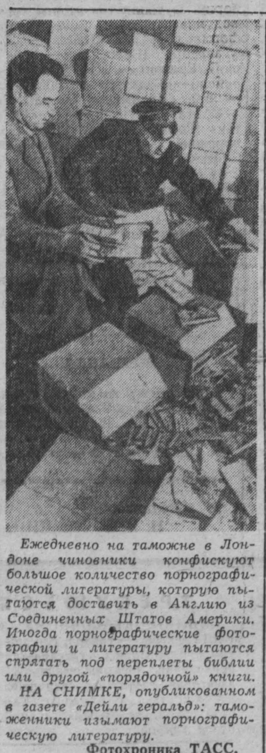
Ежедневно на тамбуре в Лондоне членами комбината большое количество порнографической литературы, которую пытаются доставить в Англию из Соединенных Штатов Америки. Иногда порнографические фотографии и литература пытаются спрятать под перелеты библии или друзей «порнобачи» книги. НА СНИМКЕ, опубликованном в газете «Дейли геральд»: таможенники изымают порнографическую литературу.

Автор приходит к закономерному выводу: Пакистану ни к чему такие посланцы госдепартамента США, ибо они приносят только вред. (АПН).