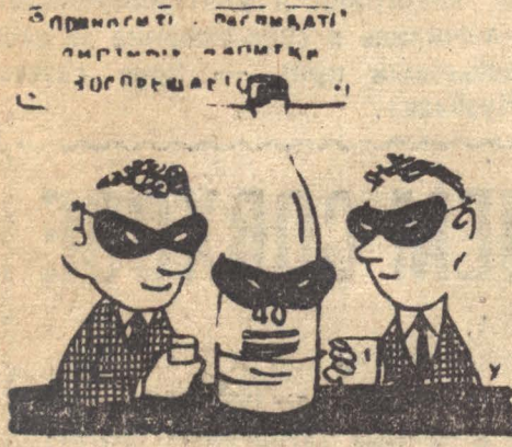
На маскараде. Рисунок М. Ушаца. (Из «Крокодила»).