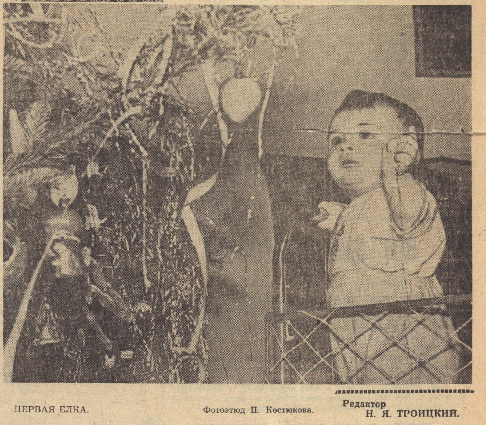
ПЕРВАЯ ЕЛКА. Редактор Н. Я. ТРОИЦКИЙ.

В новом здании театра с 1 по 12 января «Дети, для вас НОВОГОДНИЕ СПЕКТАКЛИ». П. Вальдгардт. КОШКИН ДОМ Оперетта по сказке С. Я. Маршак. Начало спектакля: 1 января в 11 и 3 часа, 2, 3, 4, 5, 7, 8, 9, 10 января в 10 и 2 часа, 12 января в 12 часов.