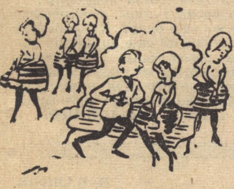
— Вы такая необыкновенная! Рисунок Ю. Федорова.