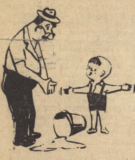
В СЕМЬЕ РЫБОВОЛА. — Вова, куда девалась моя рыбка? — Ее съела во-от такая кошечка! Рисунок М. Ушаца.