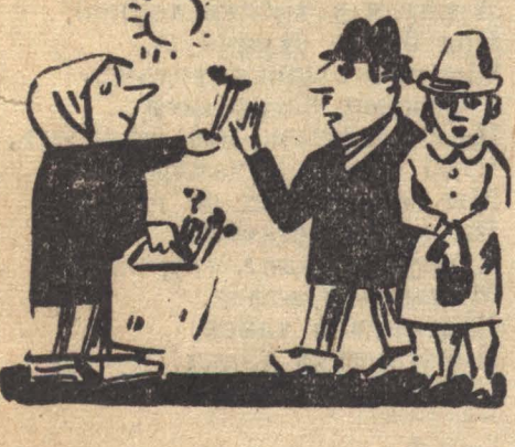
— Не надо. Мы женаты! Рисунок Р. Матюшина.