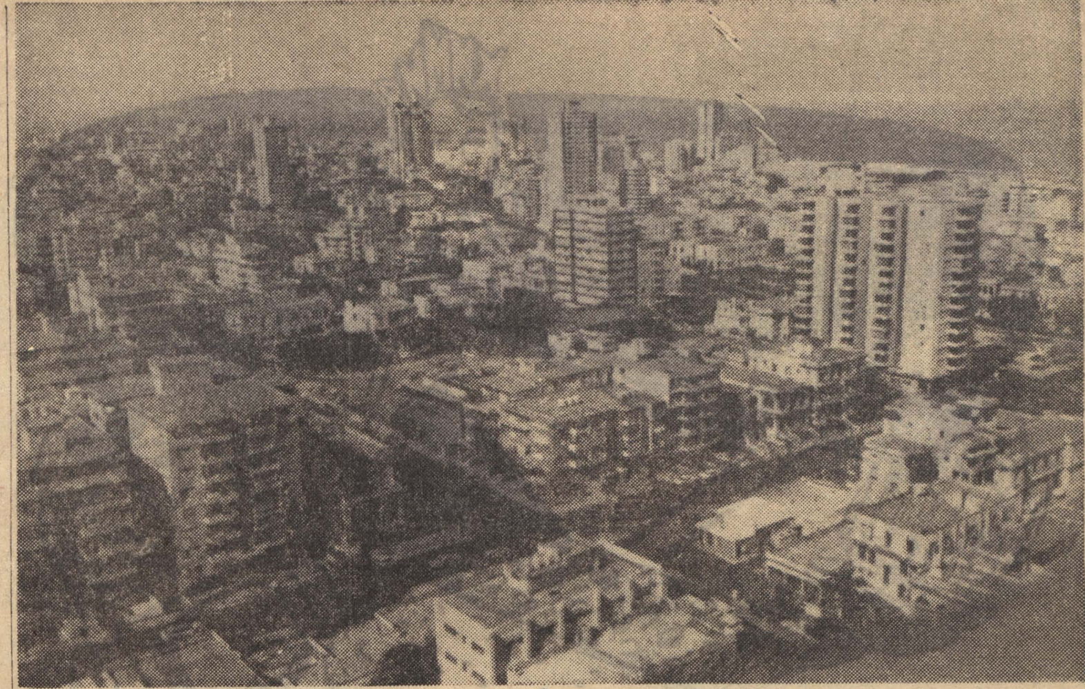
Гавана. Столица Кубинской Республики — город Гавана.

люции, личную выгоду. Но знаю одно: и мне, и моему народу она дала много. Взяв хотя бы квартиру. Теперь она снижена на пятьдесят процентов. Вдвое меньше платим за пользование электричеством, телефоном. До революции тысячи и тысячи кубинцев жили в нужде, ходили босиком. Вы знаете, почему на острове так много было больных кишечными заболеваниями? Потому что кубинцы не имели обуви. В магазинах не имели одежды. Люди ходили босиком. Переносчики паразитов любят голые пятки. Да что обувь? Многим просто нечего было есть. Без СССР мы не смогли бы выстоять. Соединенные Штаты отказались продавать нам нефть, тогда мы стали закупать ее у Советского Союза. Американцы отказались покупать у нас сахар, тогда его стали покупать СССР и другие социалистические страны. А сколько советских специа-