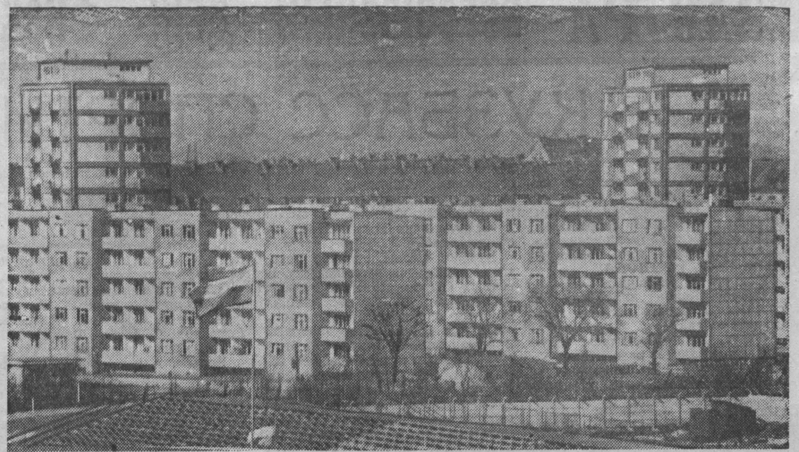
Крем молодости называют в Польше западные земли. И это действительно так. Все здесь создано за годы народной власти. Дымит труба более 10 тысяч предприятий, работают многочисленные научно-исследовательские институты, на полях и рунки поднялись города с жилыми домами, школами, магазинами. На снимке: новый жилой дом-комплекс во Вроцлаве. Ежегодно 4-5 тысяч семей празднуют новоселье в этом красивом зеленом городе.

о невыводе на космическую орбиту оружия массового уничтожения и шагах, предпринятых СССР, Соединенным Королевством и США в первые месяцы этого года в целях сокращения производства плутония и обогащенного урана. Это — значительные и полезные шаги, однако они являются лишь первыми шагами. Предстоит еще разрешить серьезные проблемы и вопросы, чтобы добиться поворота к ослаблению тонки вооружений, эффективного разоружения и надежного мира. Проявляя искреннюю заботу о подлинных интересах всех наций и предпринимая конструктивные