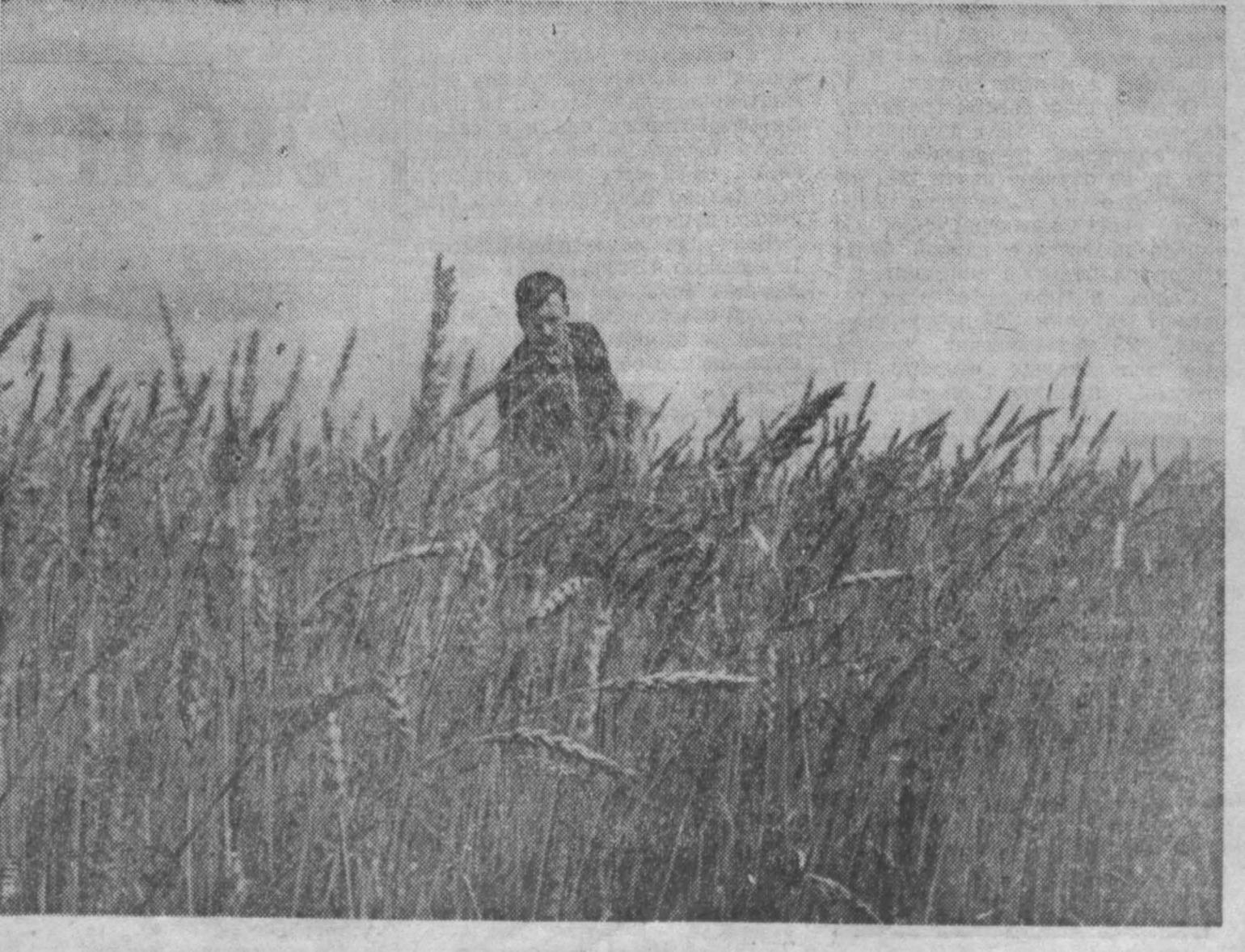
Созревает пшеница в колхозе «Красное знамя» Промышленновского управления.