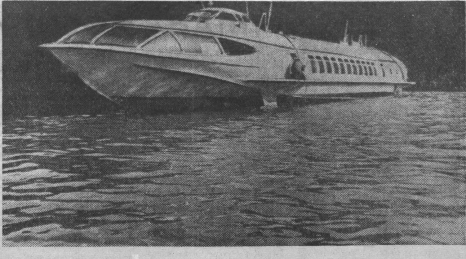
Коллектив горьковского завода «Красное Сормово» работает над созданием судов на подводных крыльях. Недавно спущен на воду новый корабль «Буревестник». Этот первый в мире крылатый газотурбоход более быстрого хода, чем его предшественник: «Ракета», «Метеор», «Спутник». Скорость «Буревестника» достигает до 100 км в час. На снимке: газотурбоход «Буревестник».